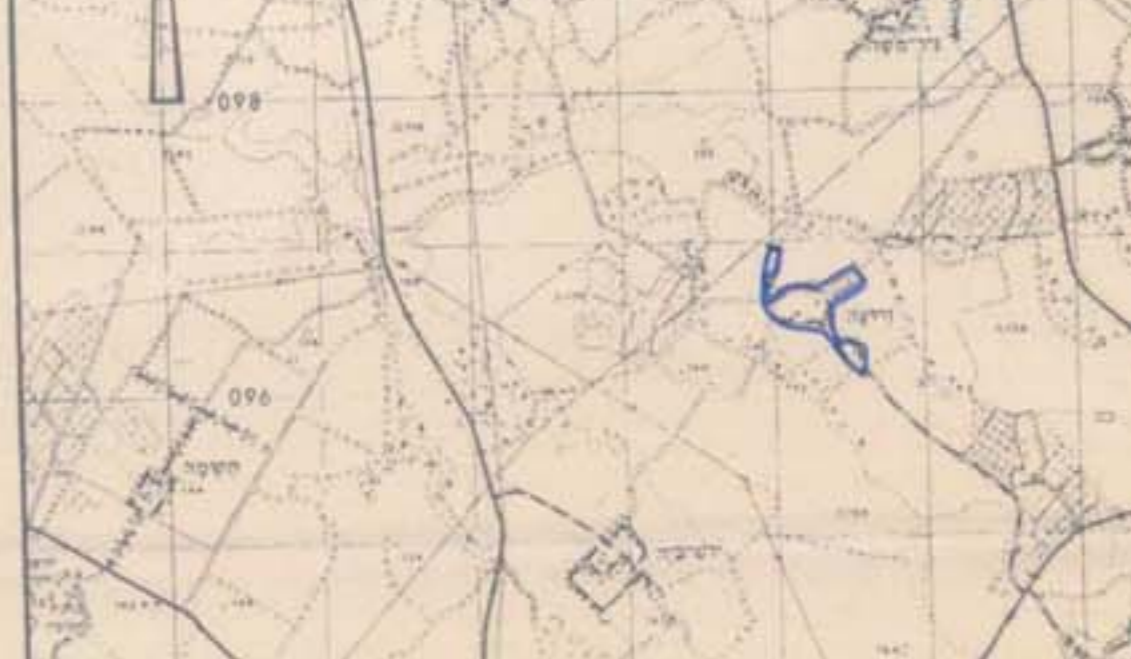
תכנית הסביבה 1:50,000