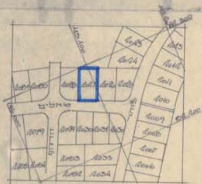
תרשים הסככה 1:1000