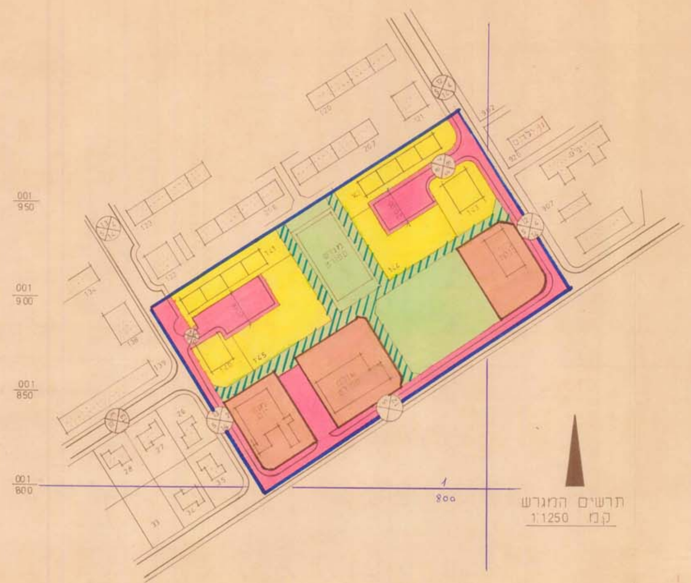
תרשים המגרש ק"מ 1:1250