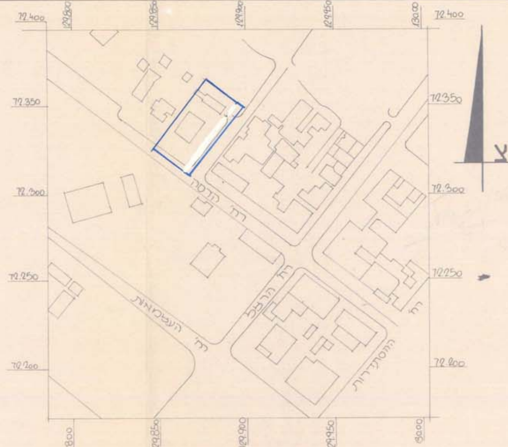
תרחישים סביבה 1:1250