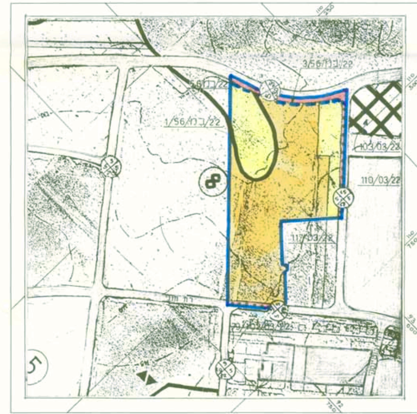
מצב קיים. קני"מ 1:5000