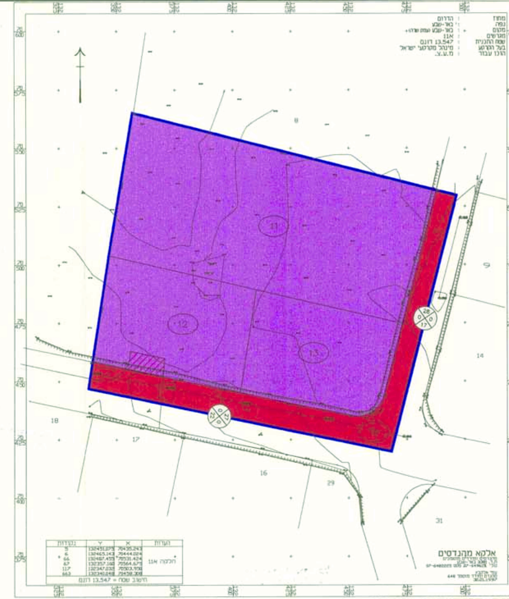
מצב קיים ק.מ. 1:1000