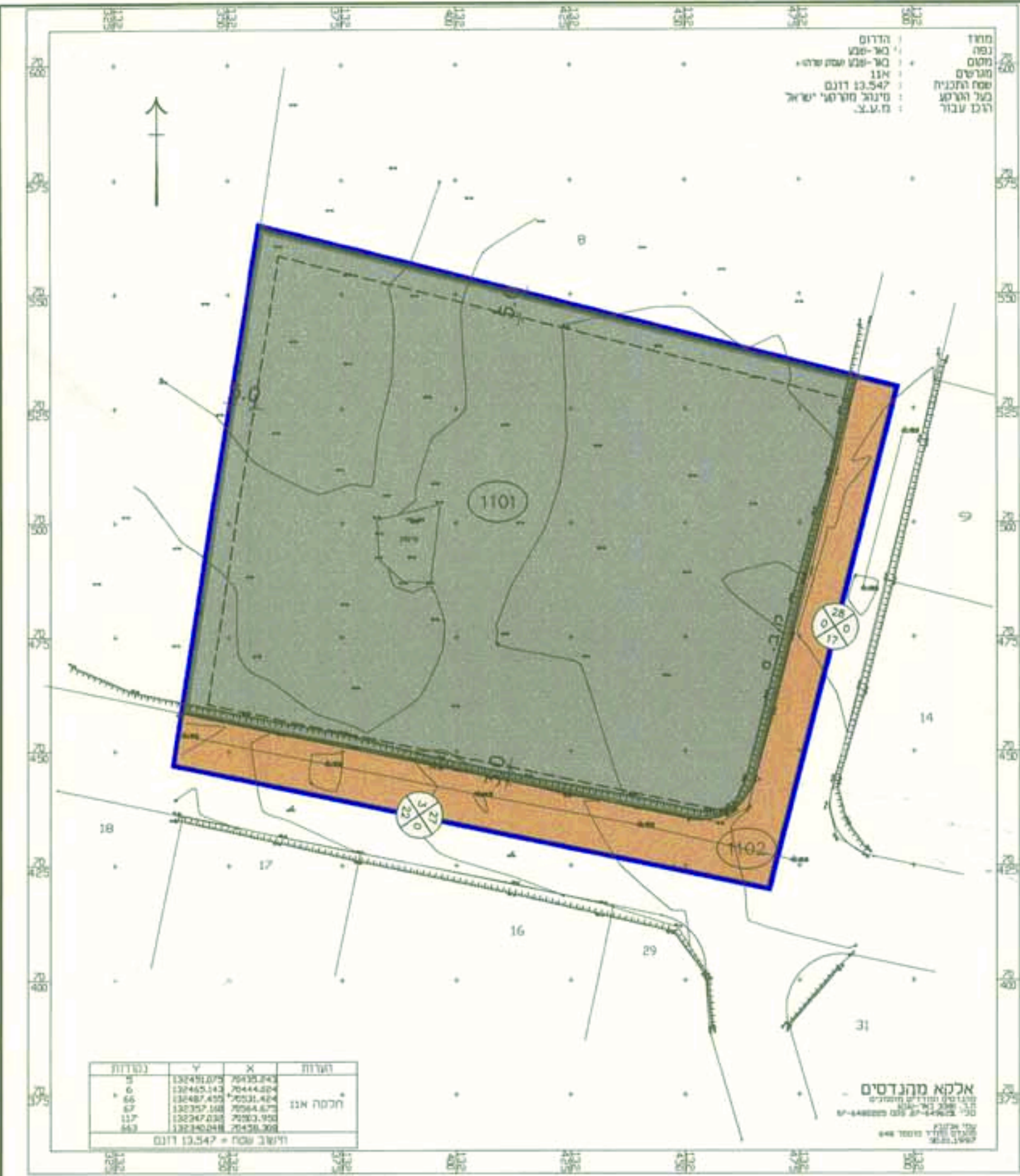
מצב מוצע ק.מ. 1:1000