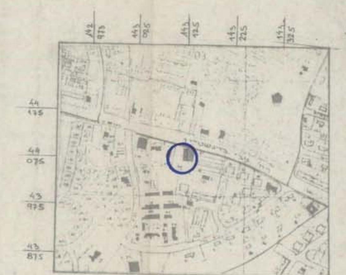
תריסם סביבה 1:5000

התוכנית בשטחם בין מצב קיים לחוצע עכצ חק שמצב קיים חשב גרסת יקים מחוצע