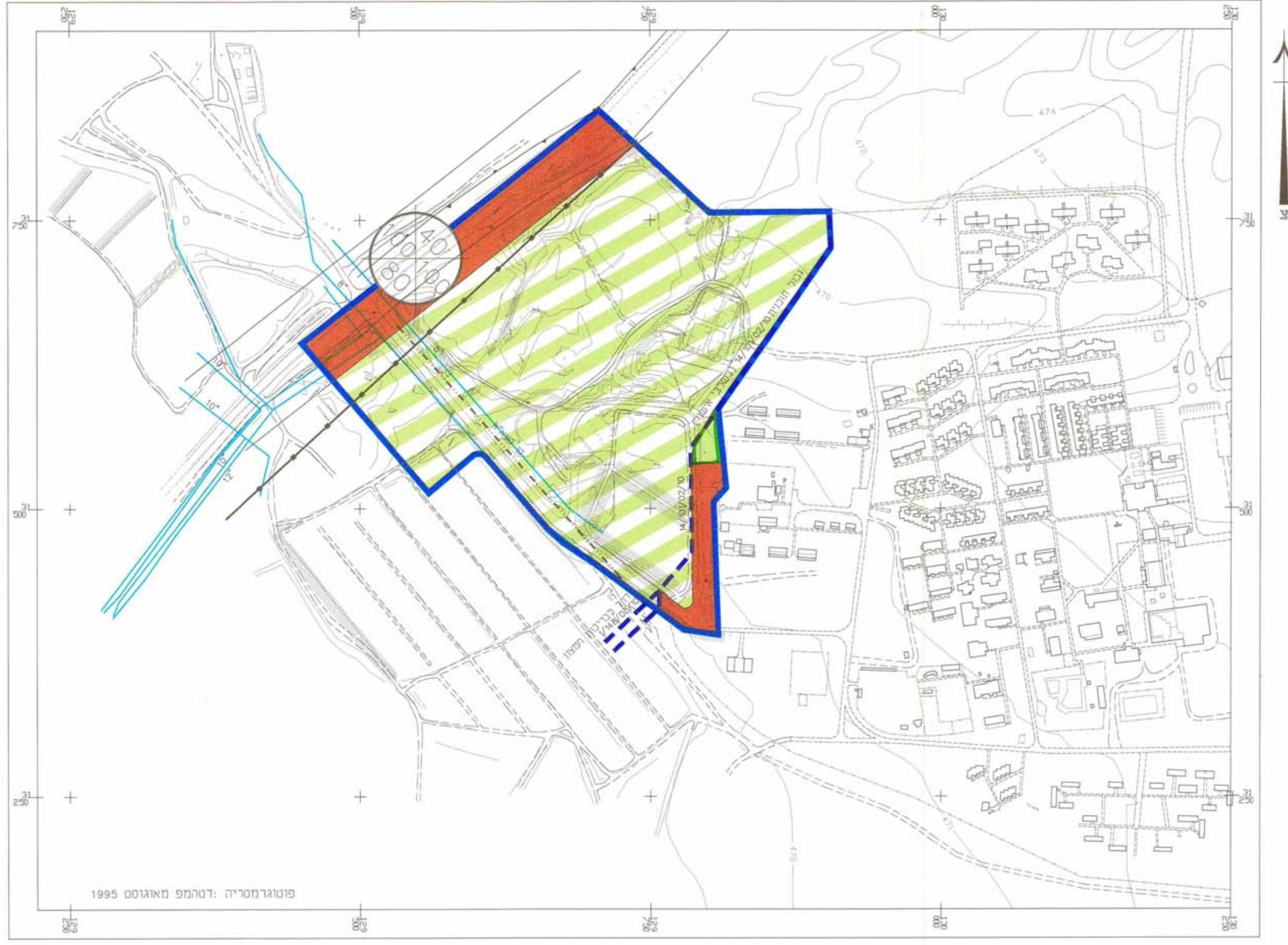
מצב קיים קנה מידה 1:2500