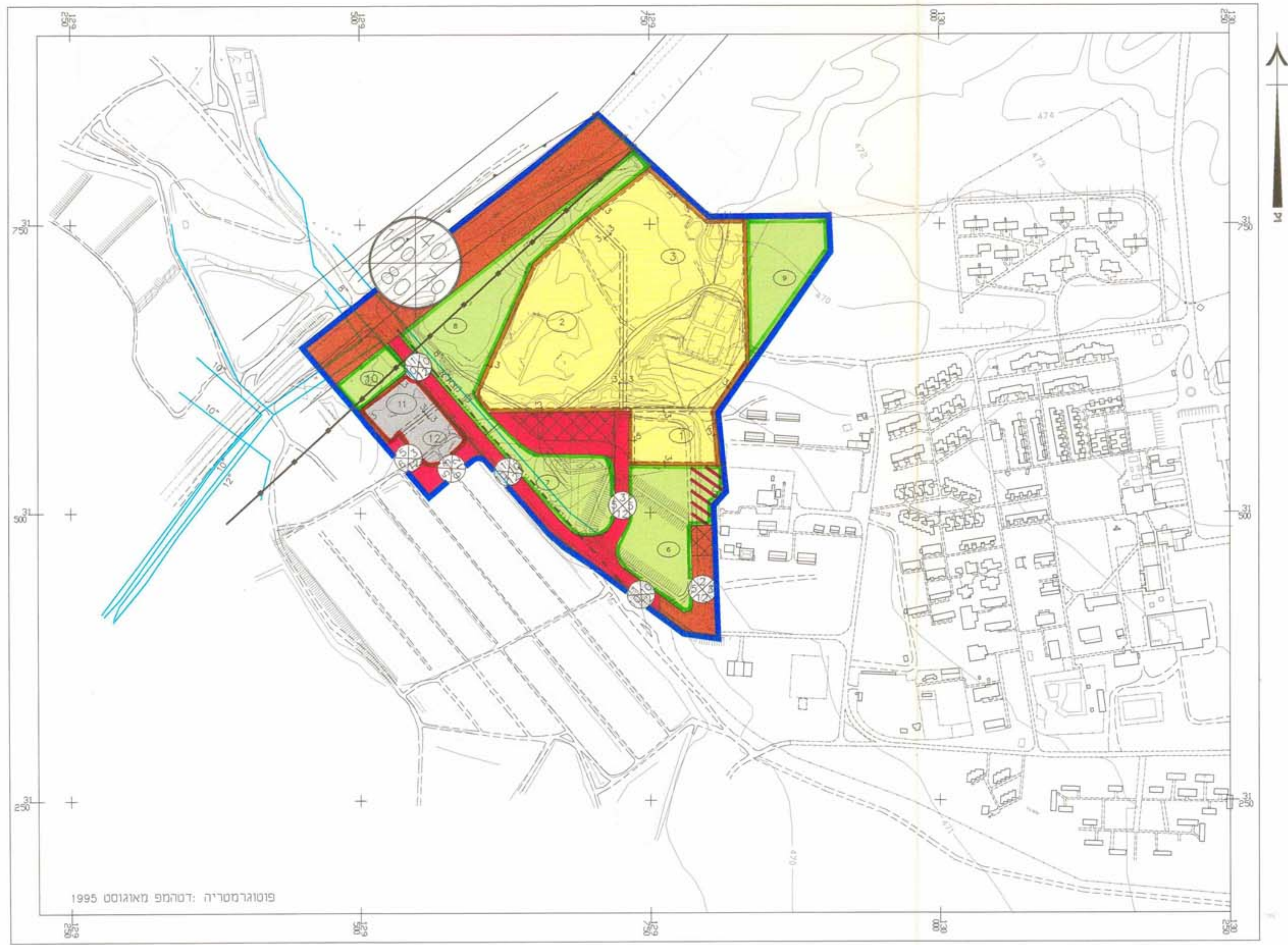
מצב מוצע קנה מידה 1:2500

משרד המגורים מחוז הדרום ש.ת.ת. המכון המחוזי 09-09-1997 מחוז הדרום