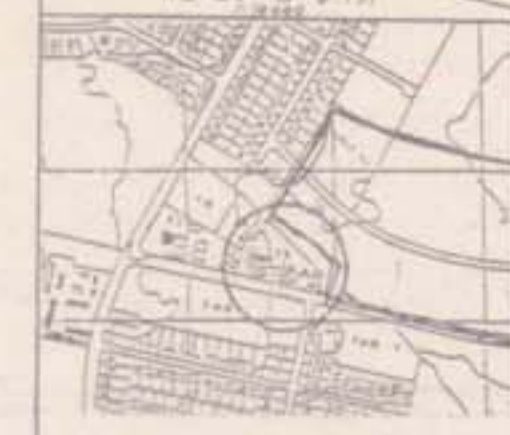
מצב מוצע 1:500

חודעה על אישור תכנית מס' 7/363/03/3 מורסמה בילקוט הפרסומים מס' 2787 מיום