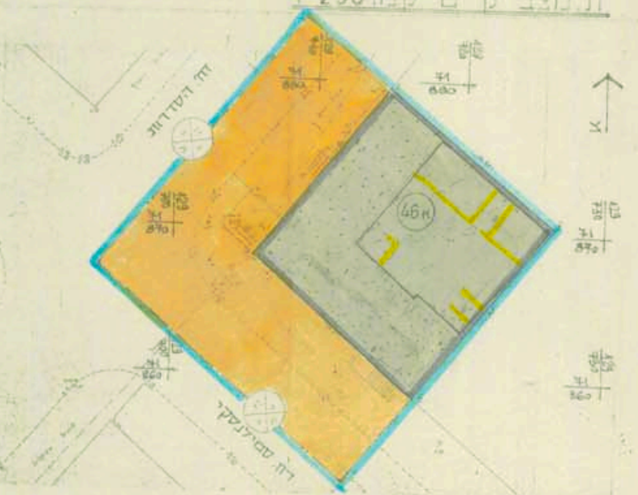
ת.מצב מוצע קמ" 1:250

מסדר המגורים מחוז הדרום חתום: חתום המחוזי-1998 מסמך תכנית מס' 61/277/5 תוכנית המועמדות לתכנון ולבנין העליון ביום: 21/12/98 מסמך תכנון