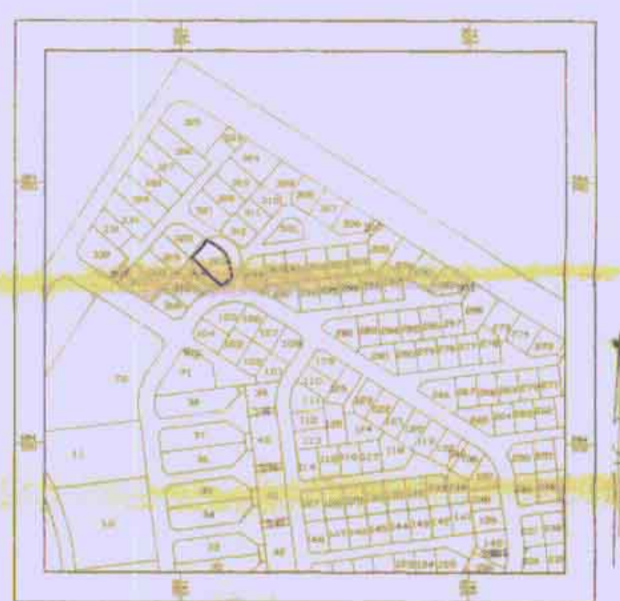
תרשים סביבה ק.מ. 1:5000

מחוז הדרום מרחב תכנון מקומי - אילת תכנית מס. 2/מק/303 ע. שינוי לתכנית 2/במ/151 מחוז : הדרום עיר : אילת גוש : בהסדר מגרש : 313 שטח : 901 מ"ר