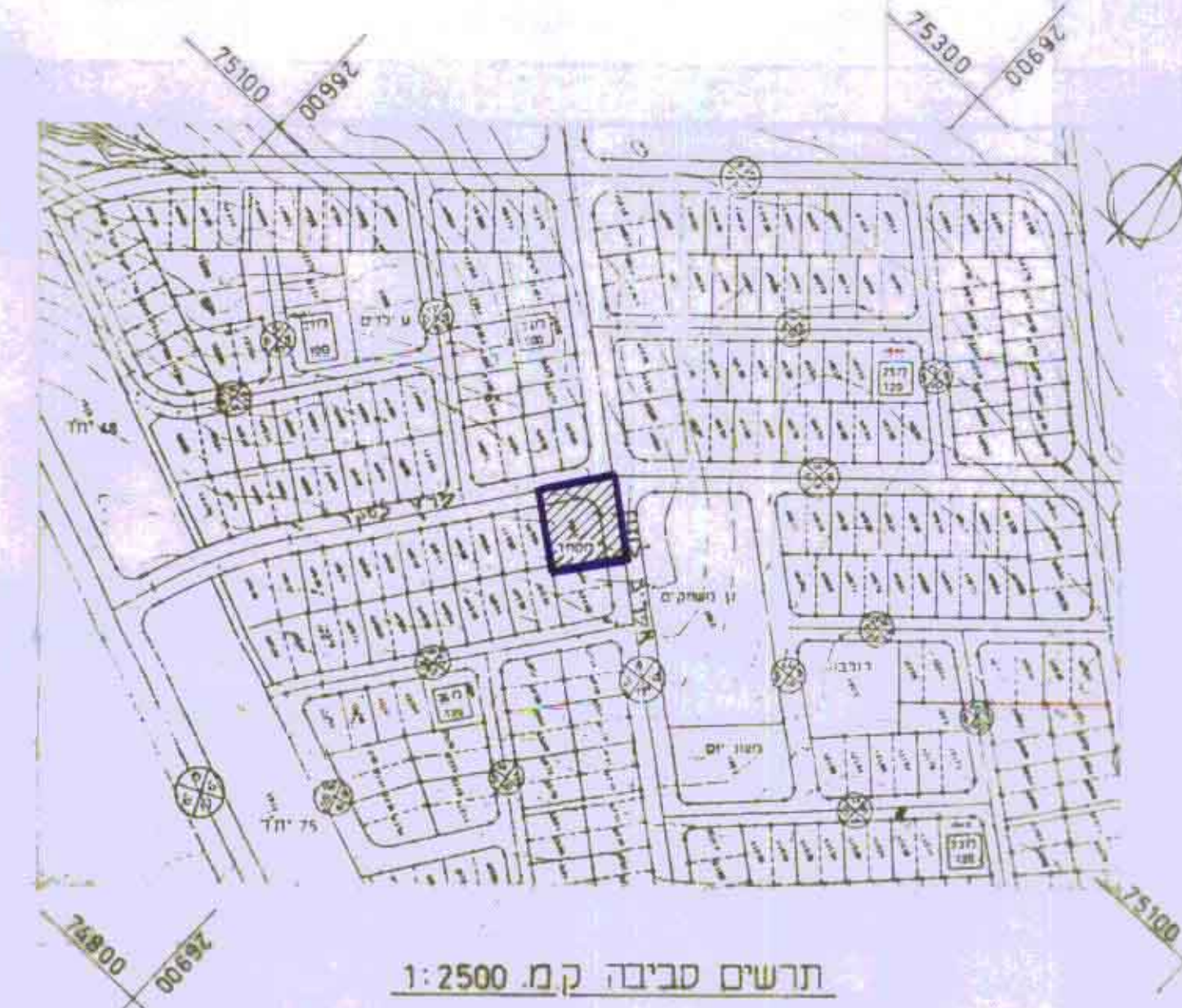
תרשים סביבה קמ. 1:2500

שנת התכנון המחזורית 13-12-1991 מחוז הדרום