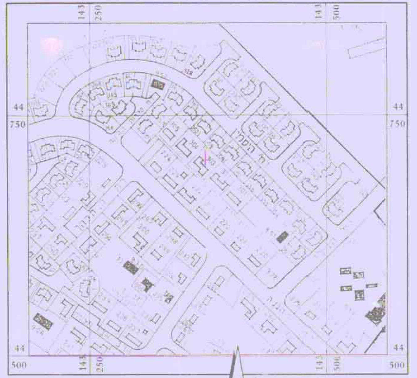
תרשים סביבה קנה מידה 1:250

הודעה על אישור תכנית מס' 2000/ת/26 מועצה בילקוט הפרסומים מס' 4718 מיום 31/12/98