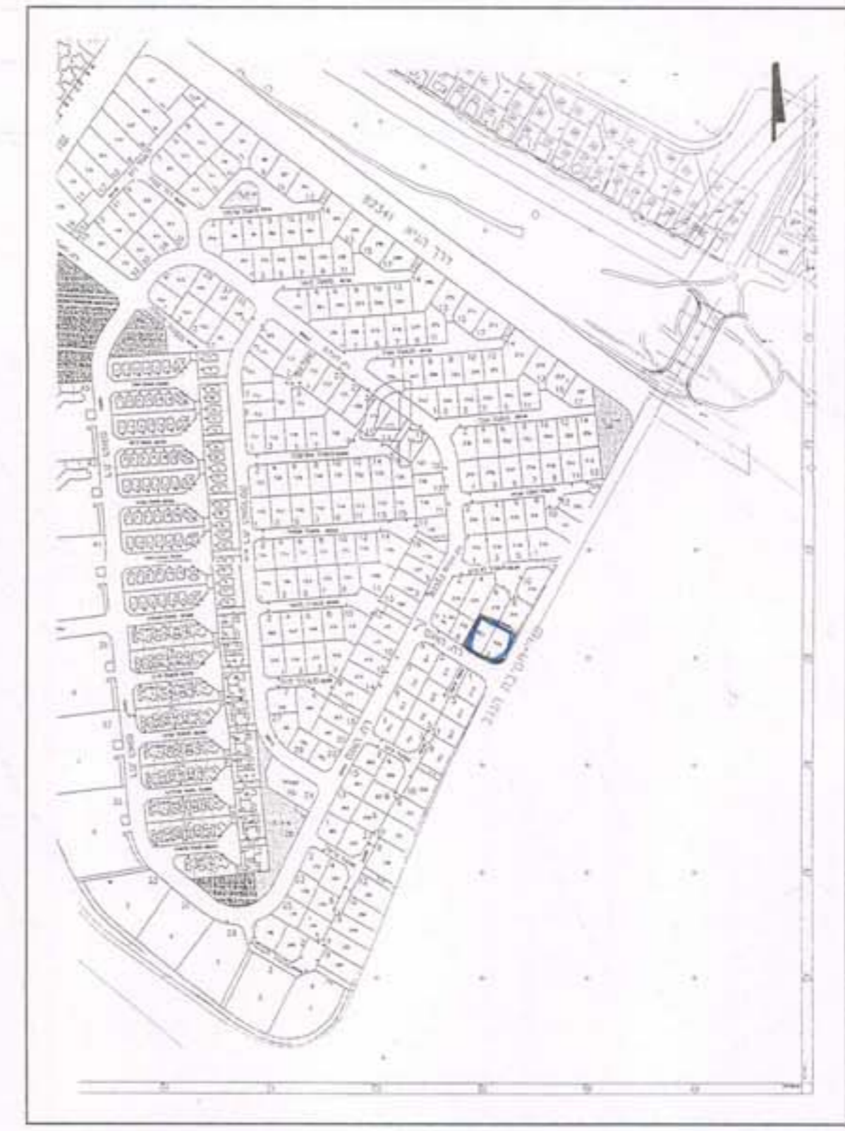
תרשים סביבה 1:5000