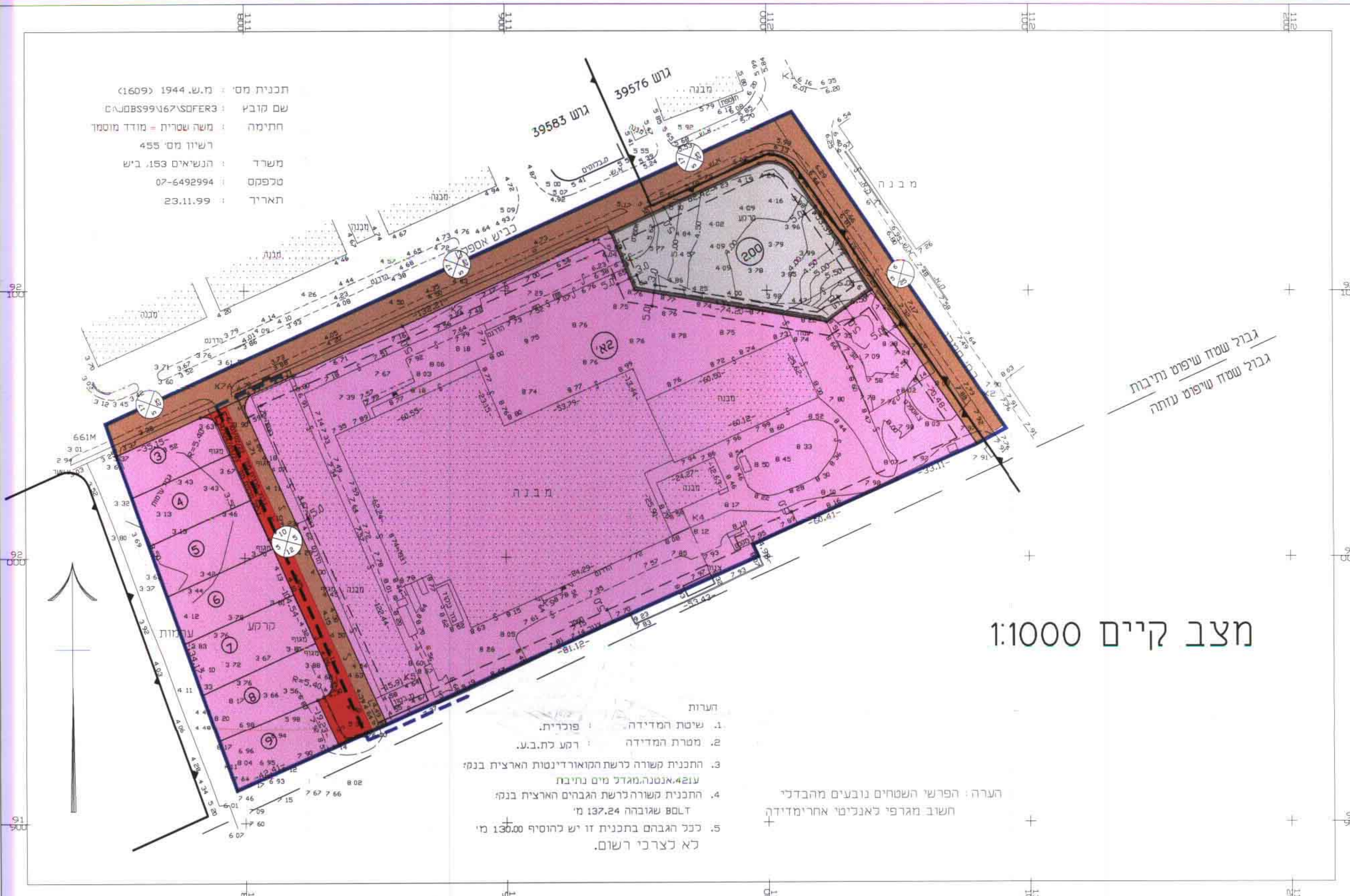
מצב קיים 1:1000