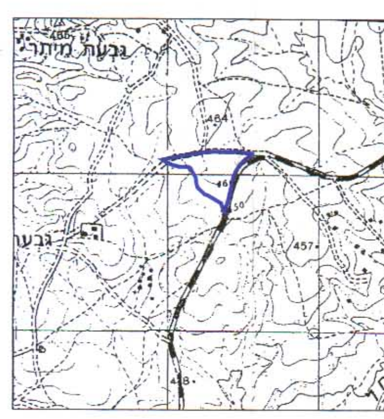
תרשים סביבה 1 : 25,000

חוק רישום שיכונים ציבוריים הוראת השעה - תשכ"ד - 1964 ועדת חאום אושר בהתאם לחוק הנ"ל תאריך: 12.12.95