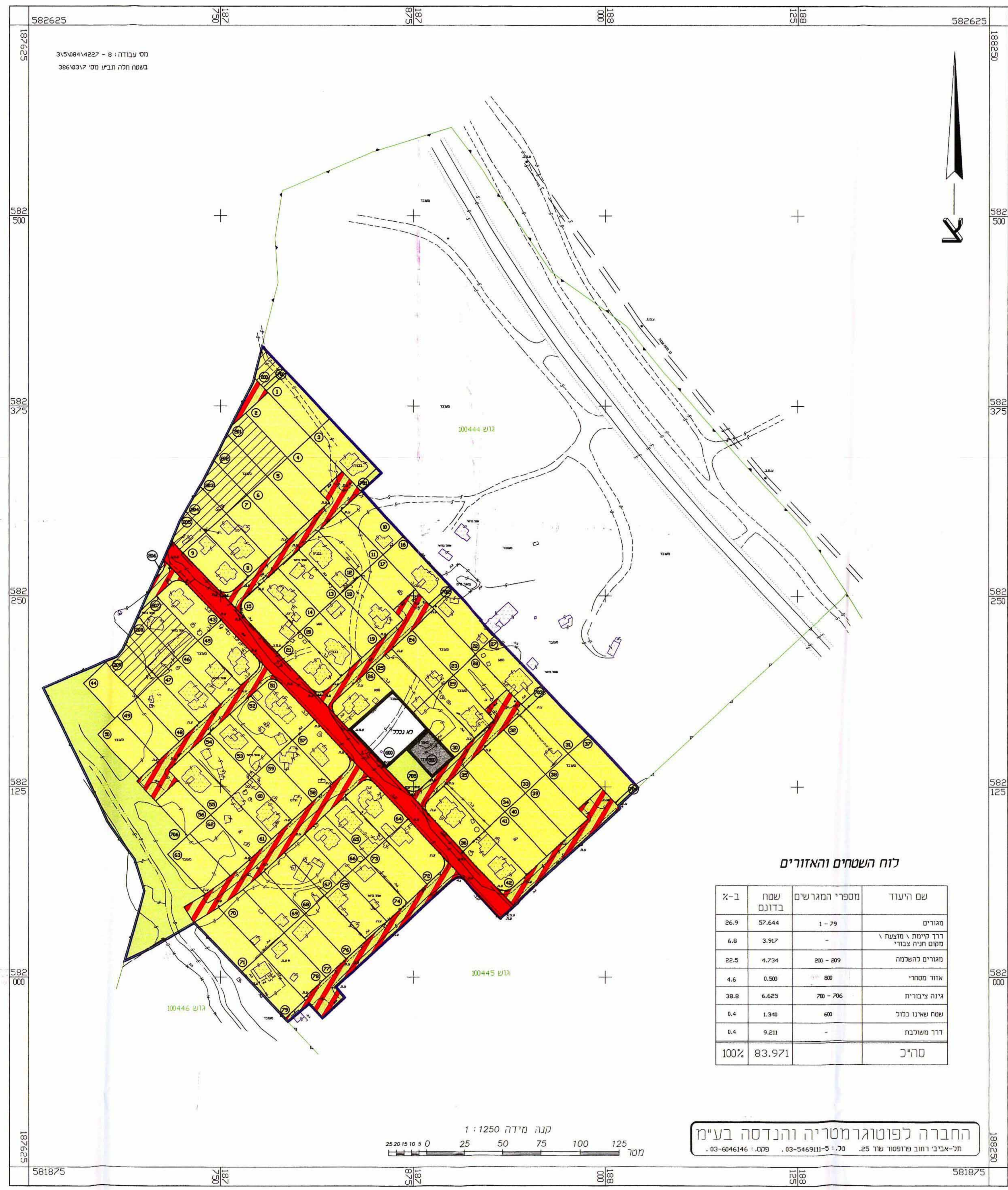
לוח השטחים והאזורים