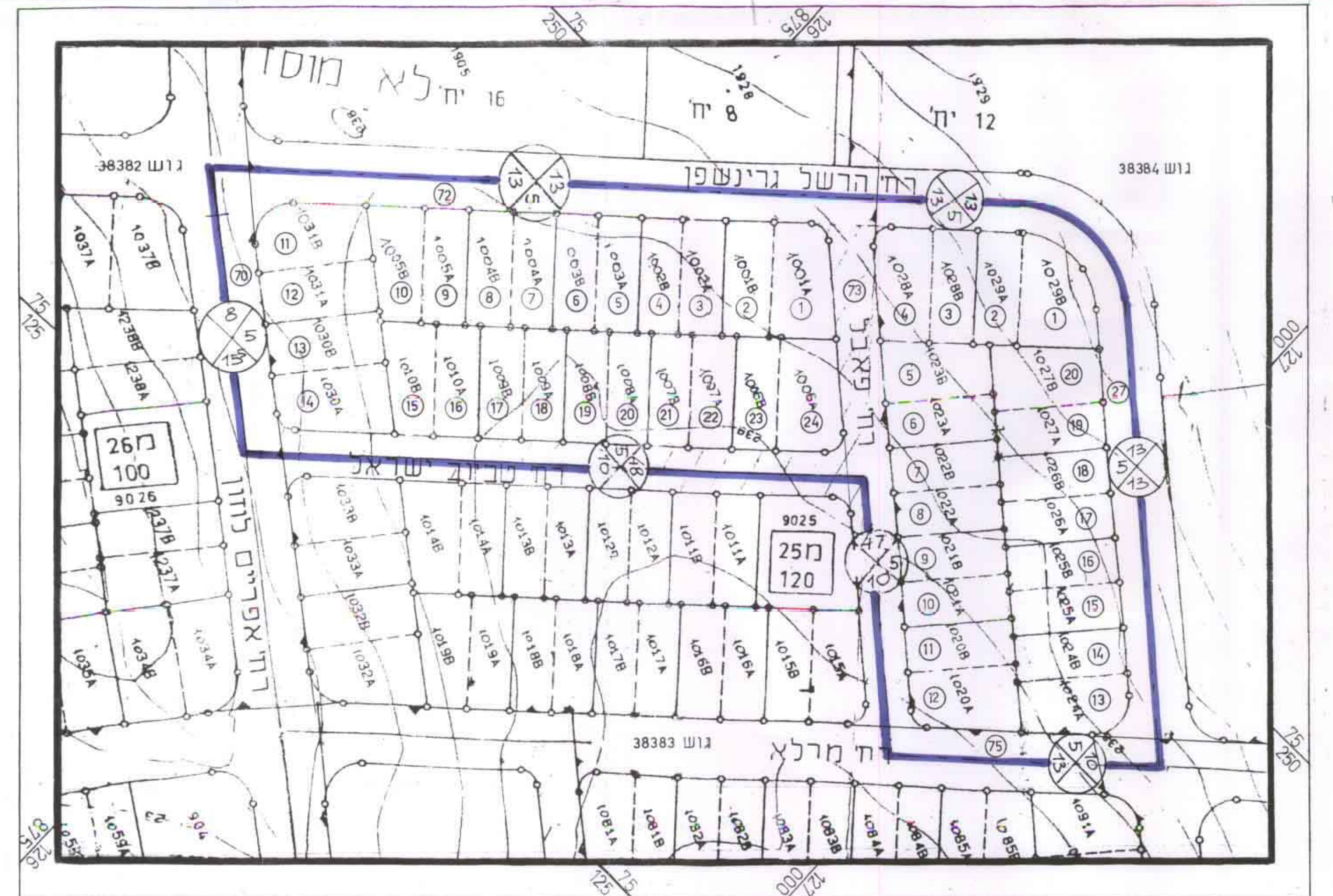
מצב קיים קני"מ 1:750

אברהם גולדנברג מחלקת אורח ומודד מוטומד במסגרת 6 ג' ת"ת תל אביב 69623; 07-469623 טלפקס במשרד; 07-232117 טל. למידע 07-232117