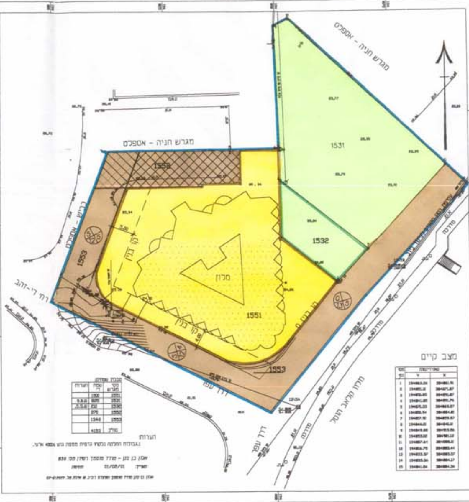
מצב קיים קנה מידה 1:500

מחוז: חדרום נפה: באר-שבע מקום: מכון עדי - אילת גוש: 40006 חלקות: 1531, 1551, 1532, 1553 הוכן בשב"כ: מכון עדי שטח התכנית: 4.486 דונם