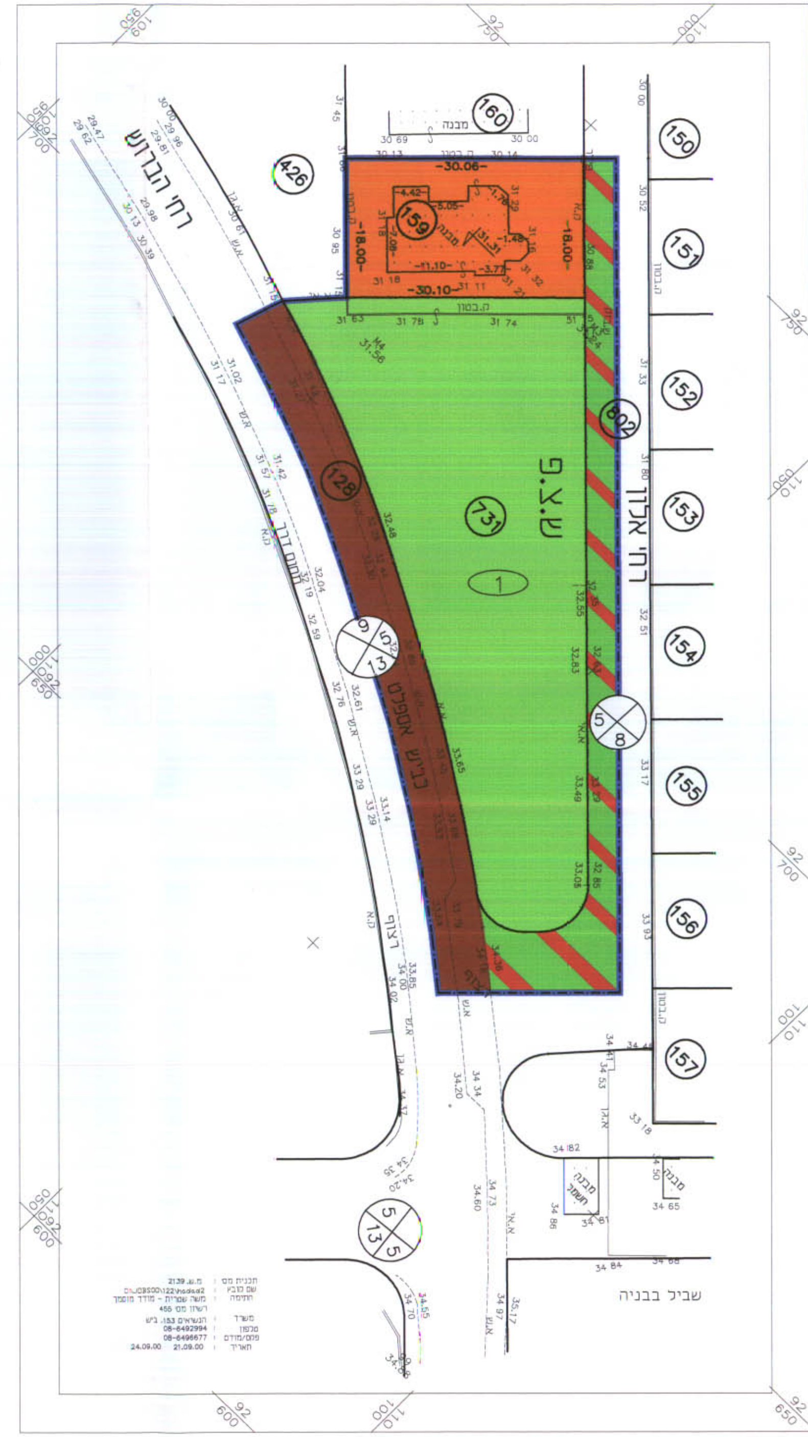
מצב קיים קנ"מ 1:500