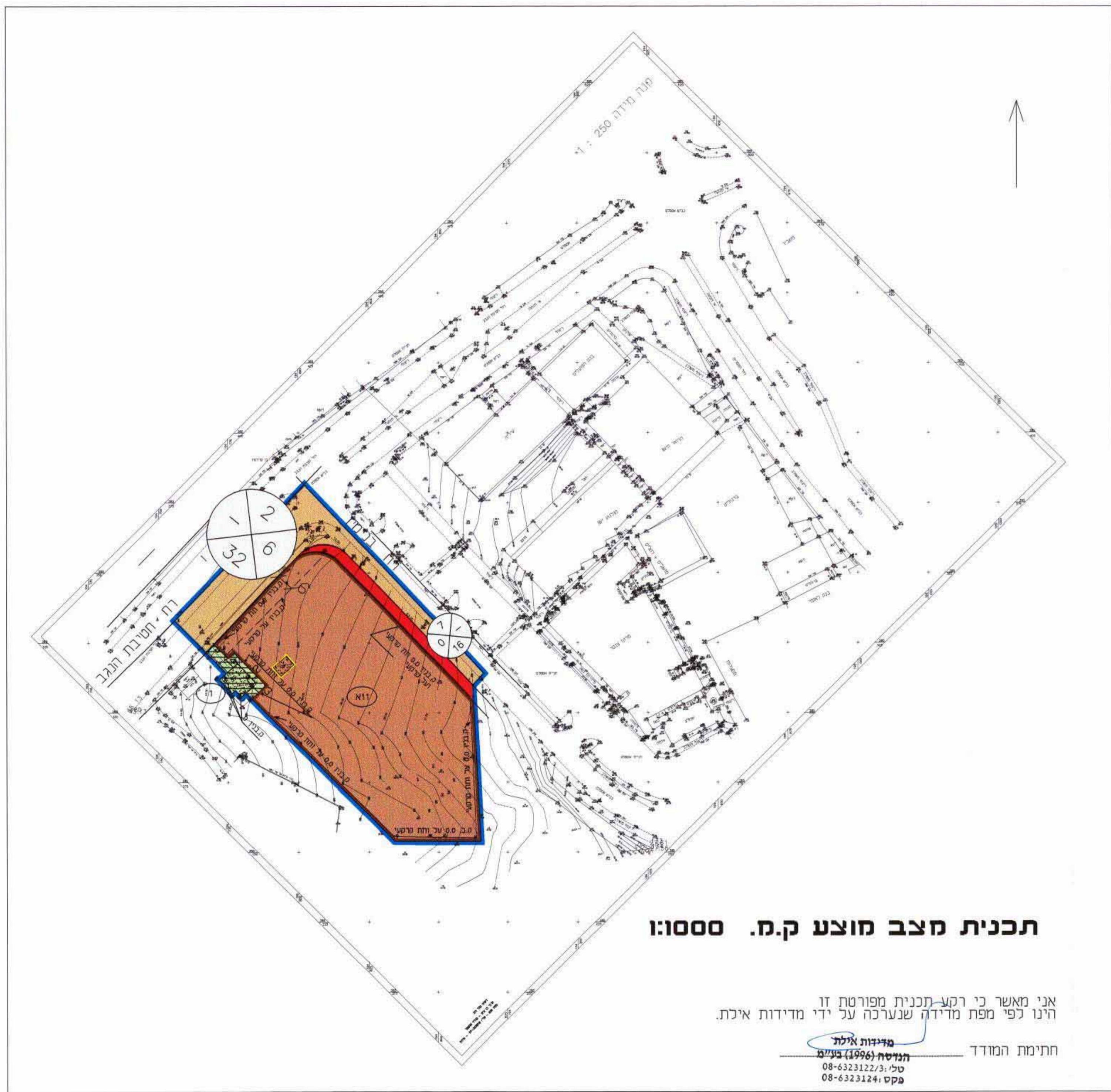
תכנית מצב מוצע ק.מ. 1:1000

אני מאשר כי רקע תכנית מפורטת זו הינו לפי מפת מדידה שנערכה על ידי מדידות אילת. תחיתום המודד מדידות אילת תחיתום (1996) בע"מ טל: 08-6323122/3 פקס: 08-6323124