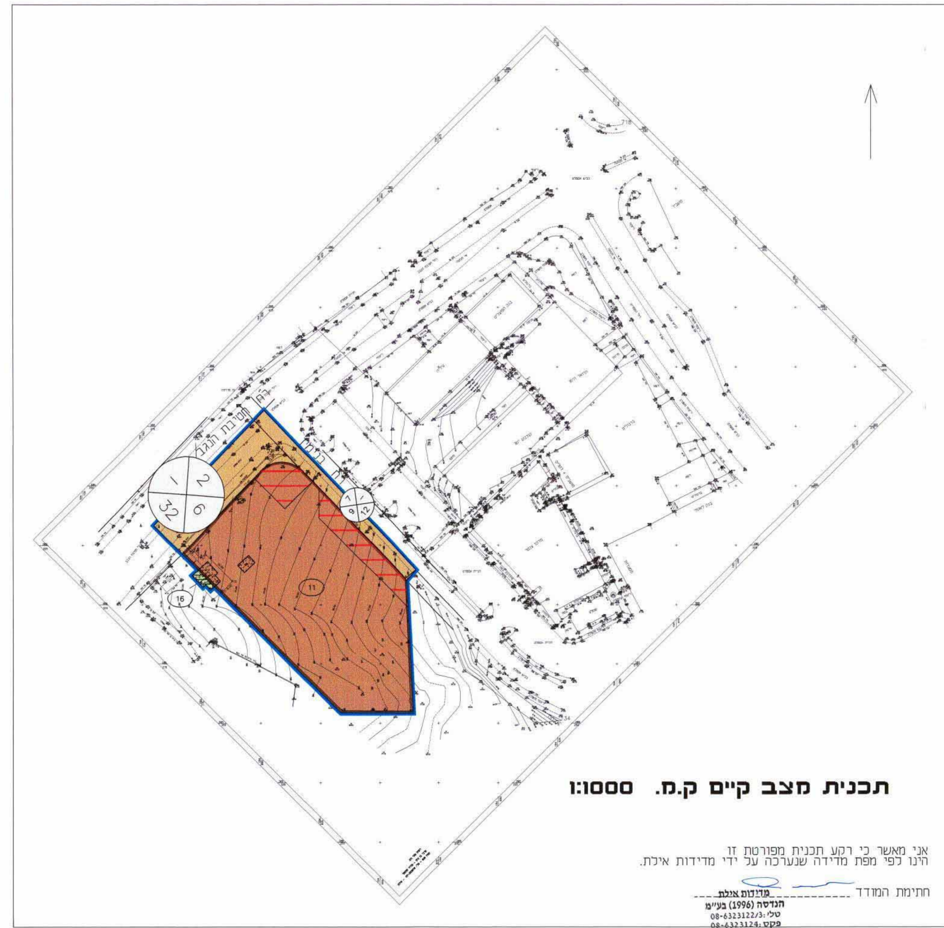
תכנית מצב קיים ק.מ. 1:1000

שרשבסקי אדריכלים בע"מ רחוב שד"ר 21 בית נועם - ב"ש טל. 08-6270689