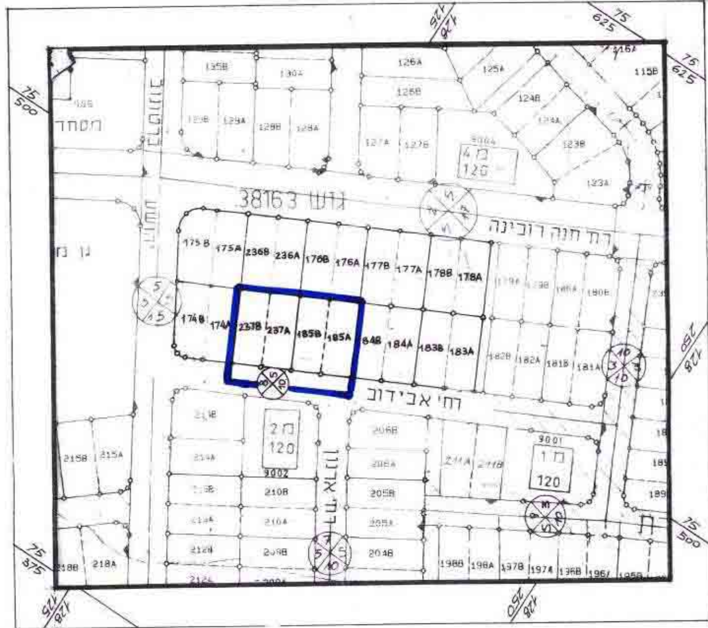
מצב קיים עבור מגרשים מס' 237A, 237B, 185A, 185B קני"מ 1:1250