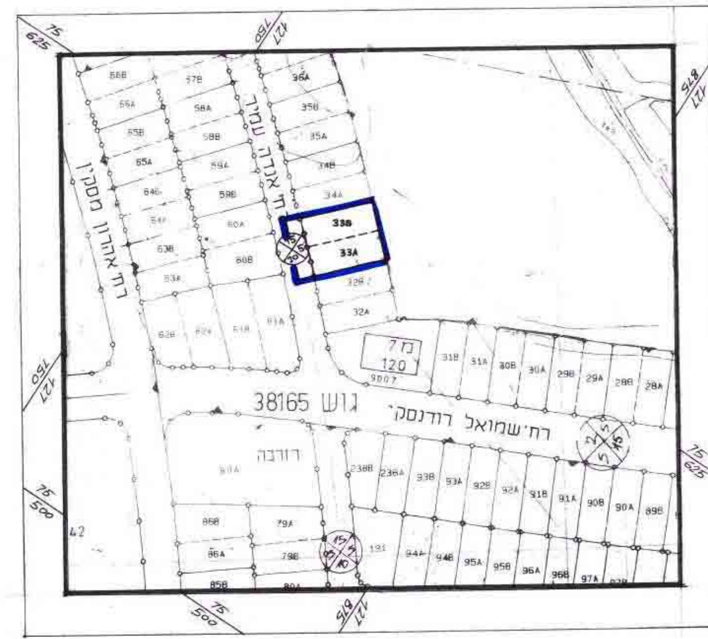
מצב קיים עבור מגרשים מס' 33A, 33B קני"מ 1:1250