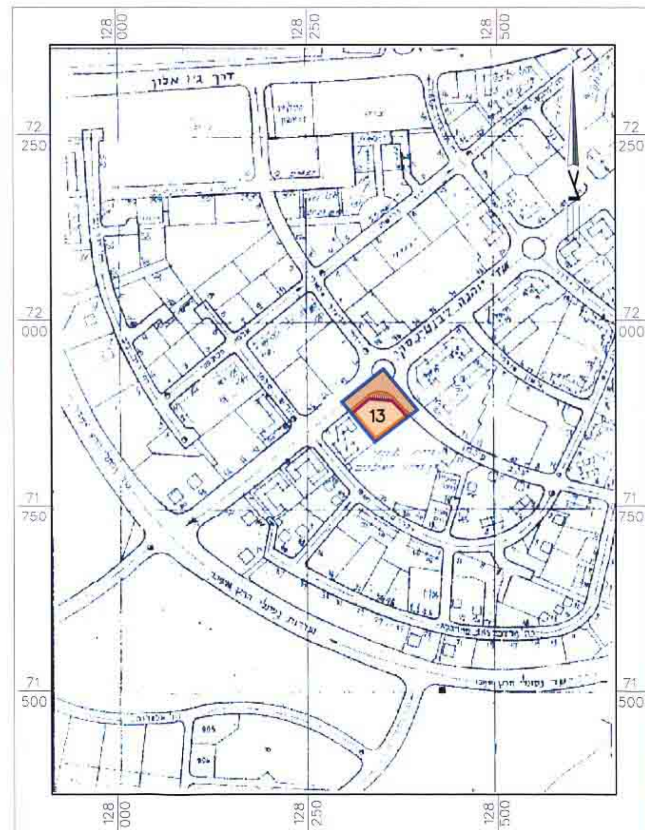
תרשים סביבה קנ"מ 1:5000

חתימת המגיס / חתימת בעל הקרקע / חתימת עורך התכנית