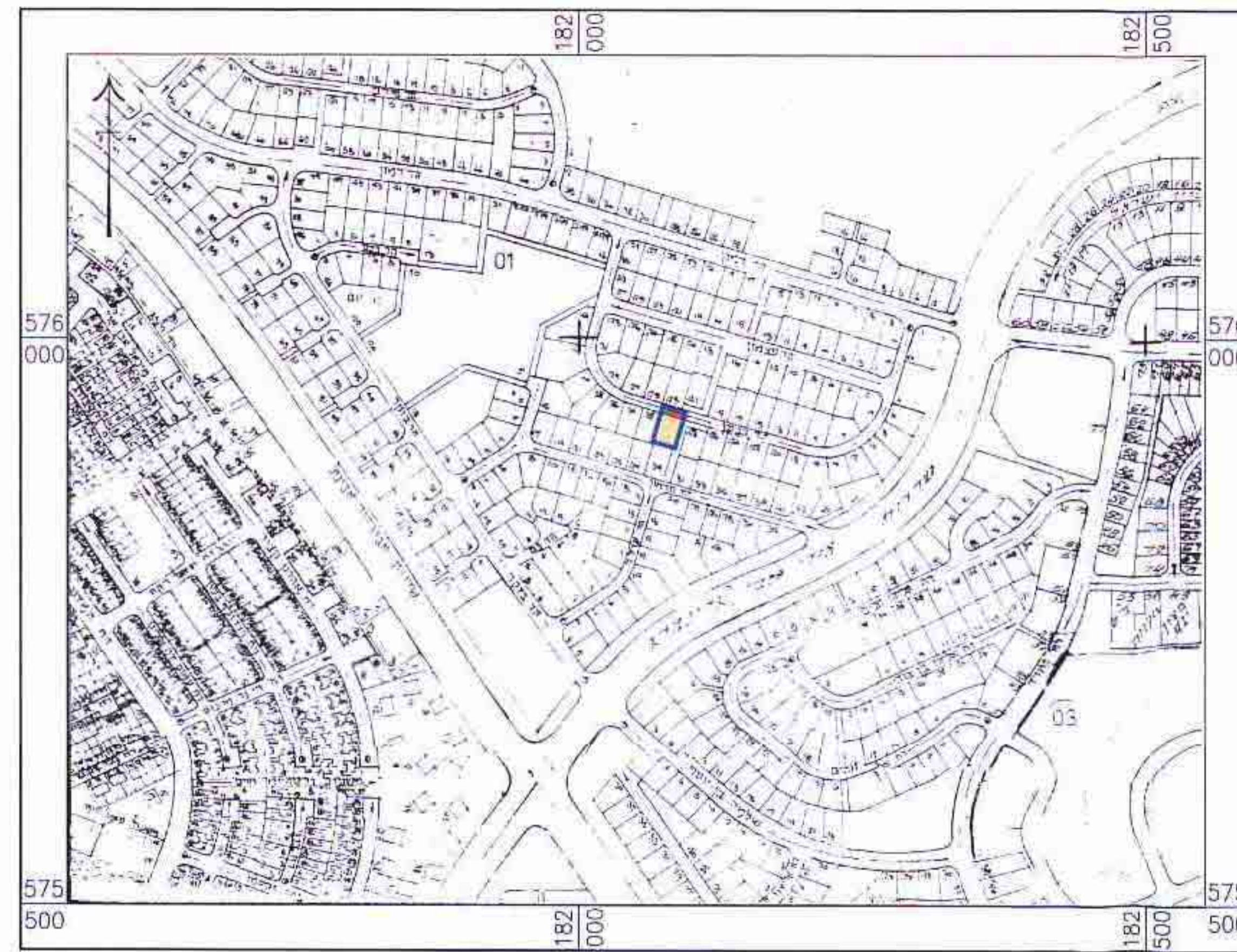
תרשים סביבה 1:5000