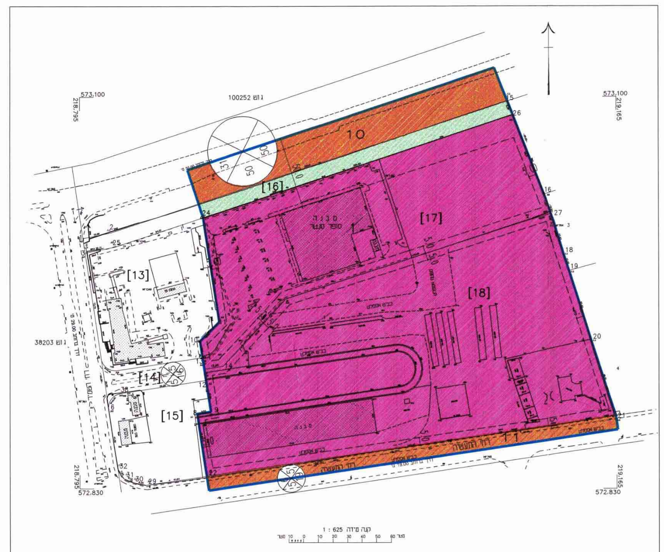
מצב קיים קנ"מ 1:1250