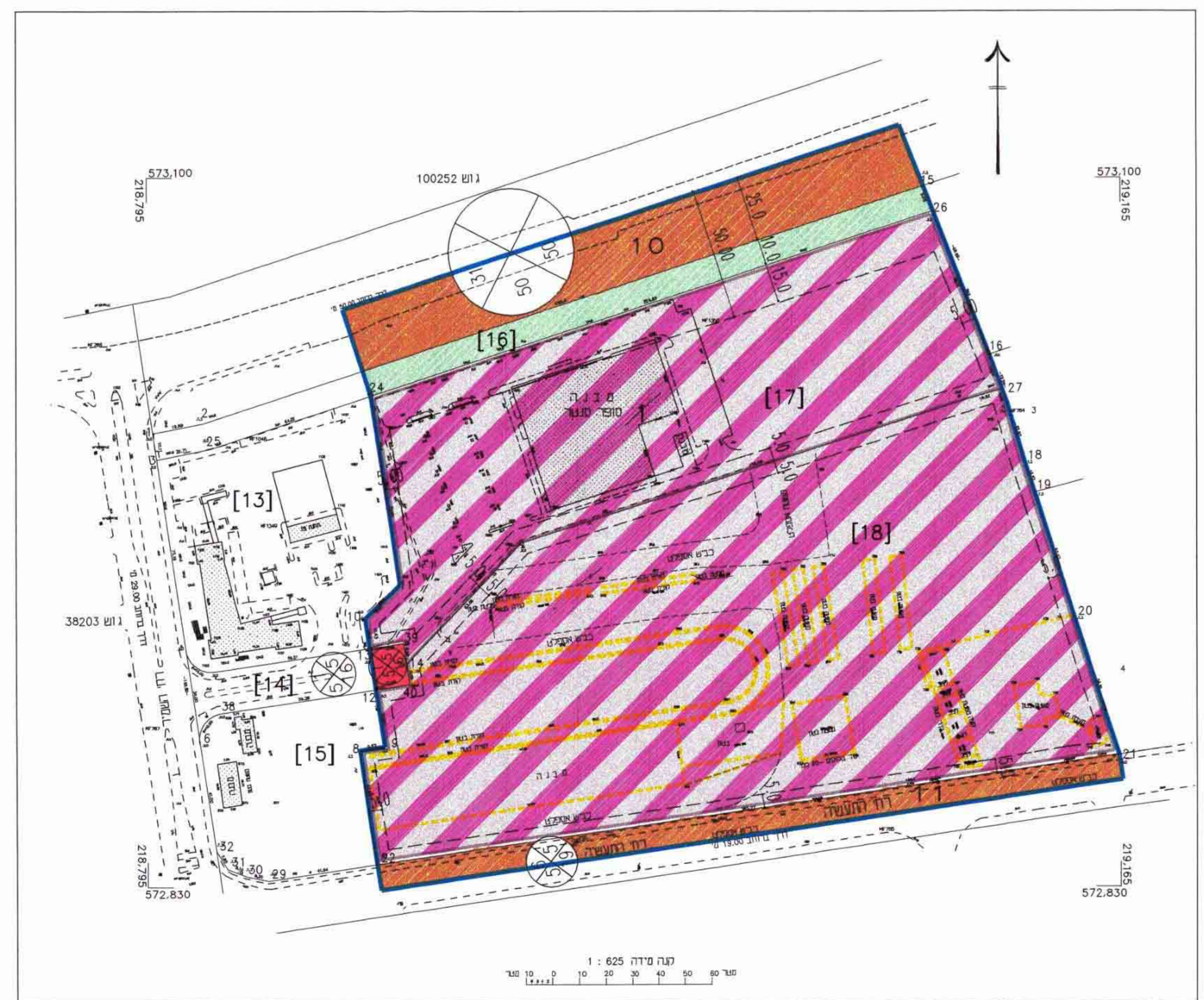
מצב מוצע קנ"מ 1:1250