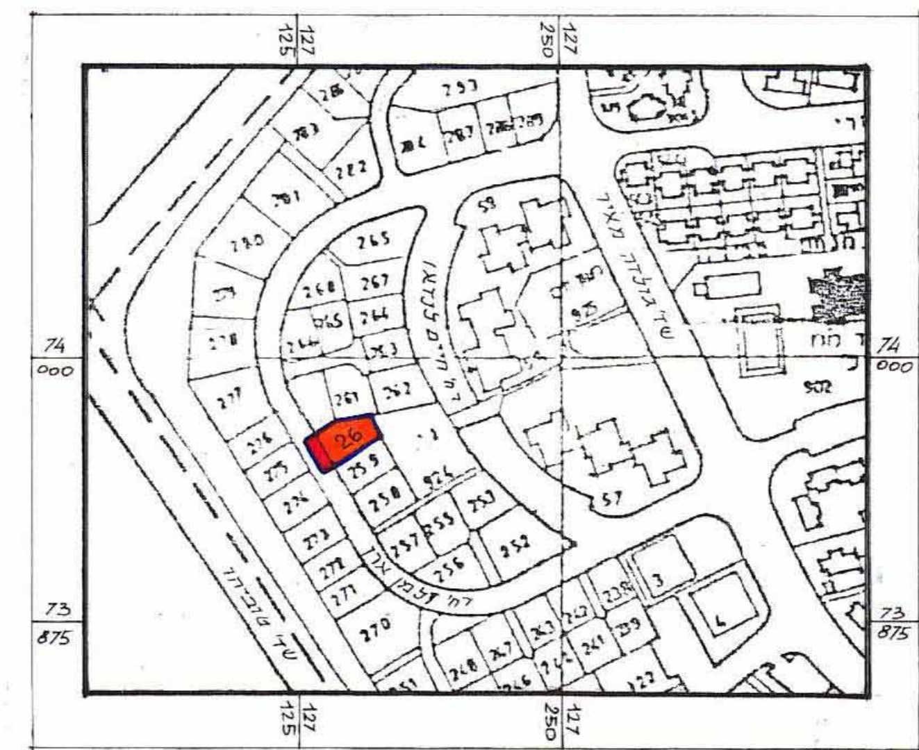
תרשים סביבה קני"מ 1:2500

רבינוביץ' ויקטור אדריכל רח' עבדת 12 באר שבע טלפקס 08-6433048 מכאפיון 052-765109 מ.מ.י. ואחרים מנהל עיריית באר שבע חתימת המגיש חתימת בעל הקרקע חתימת עורך התכנית