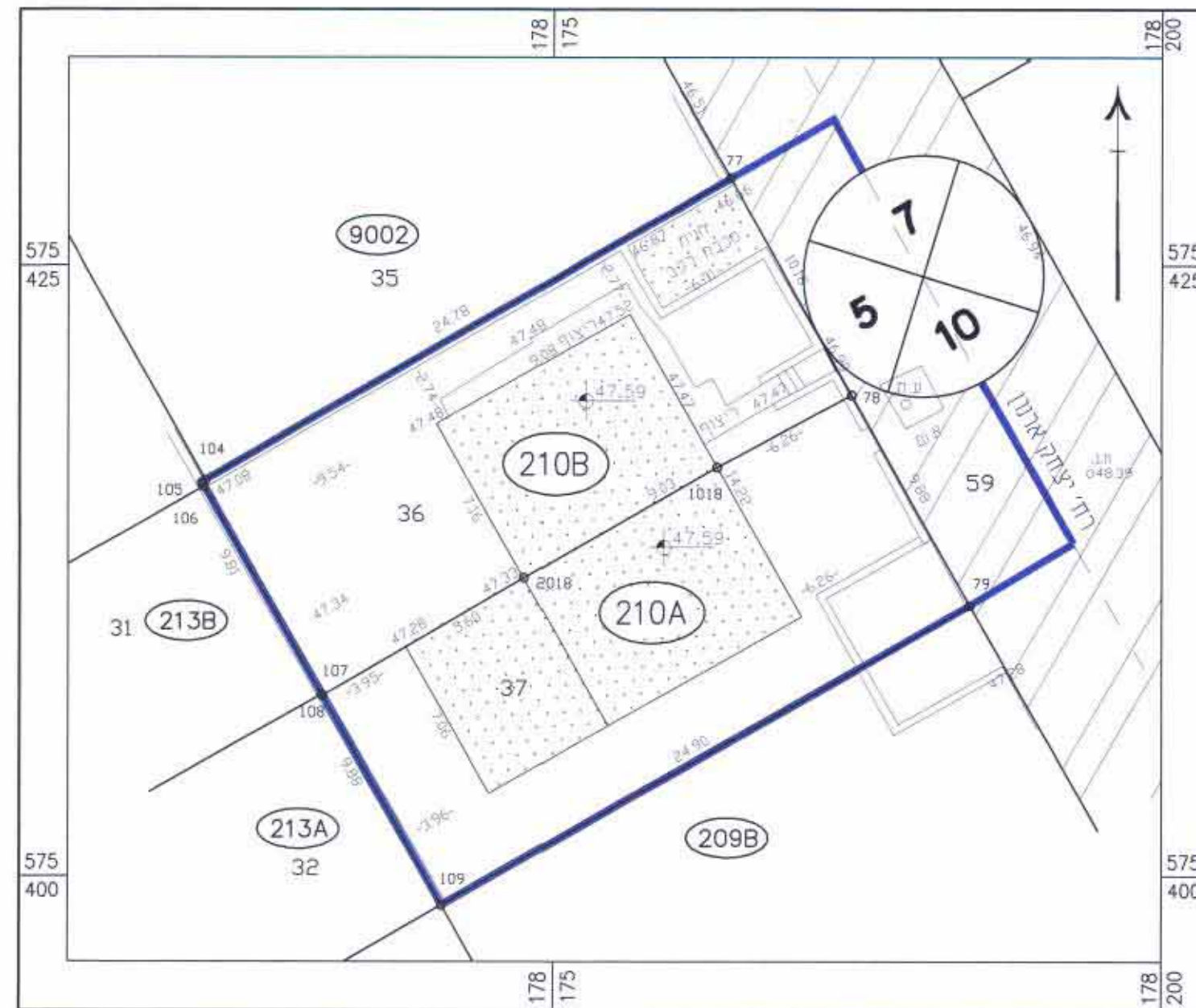
מצב קיים 1:250