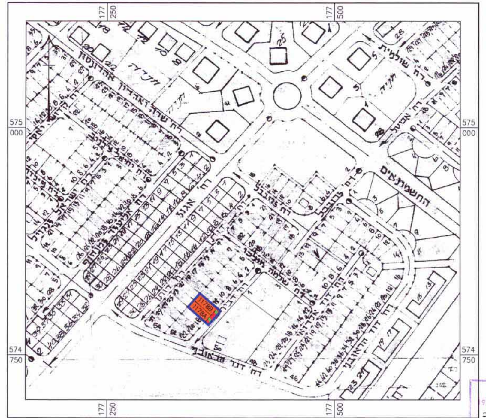
תרשים סביבה 1:2500