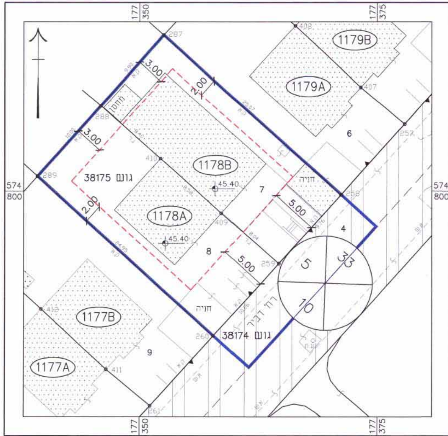
מחצית קיים 1:250