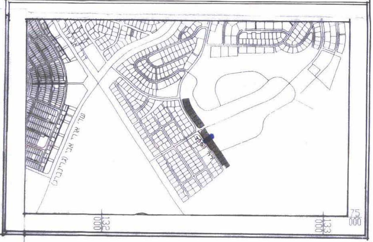
תרשים סביבה 1:10,000