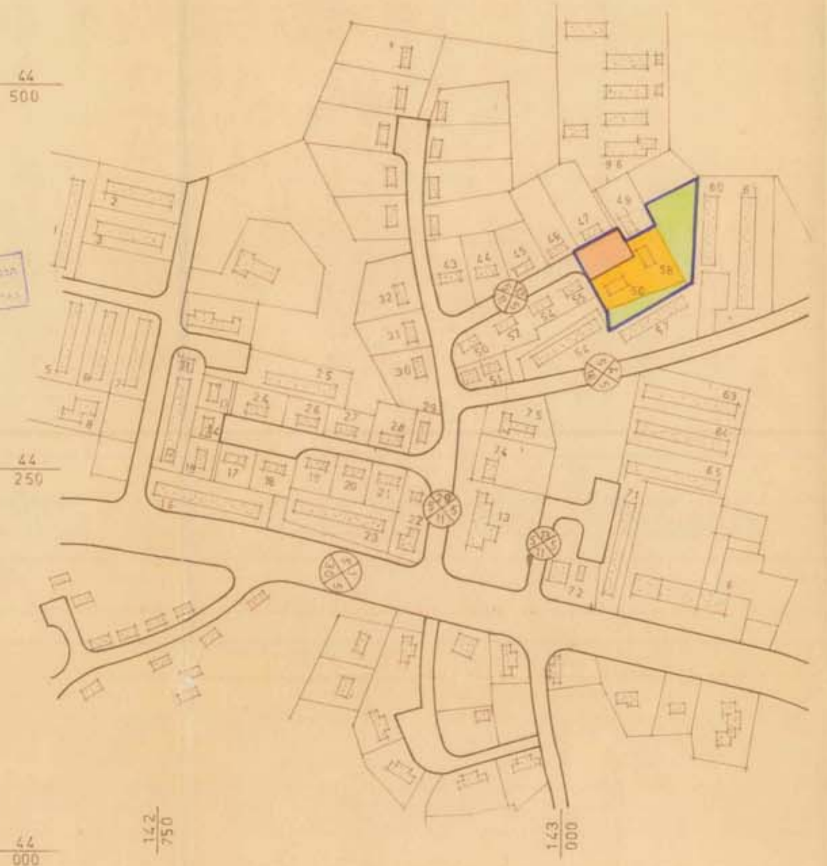
ת.ש.צ. מאושרת 4/15/1 ק.מ. 1:2500