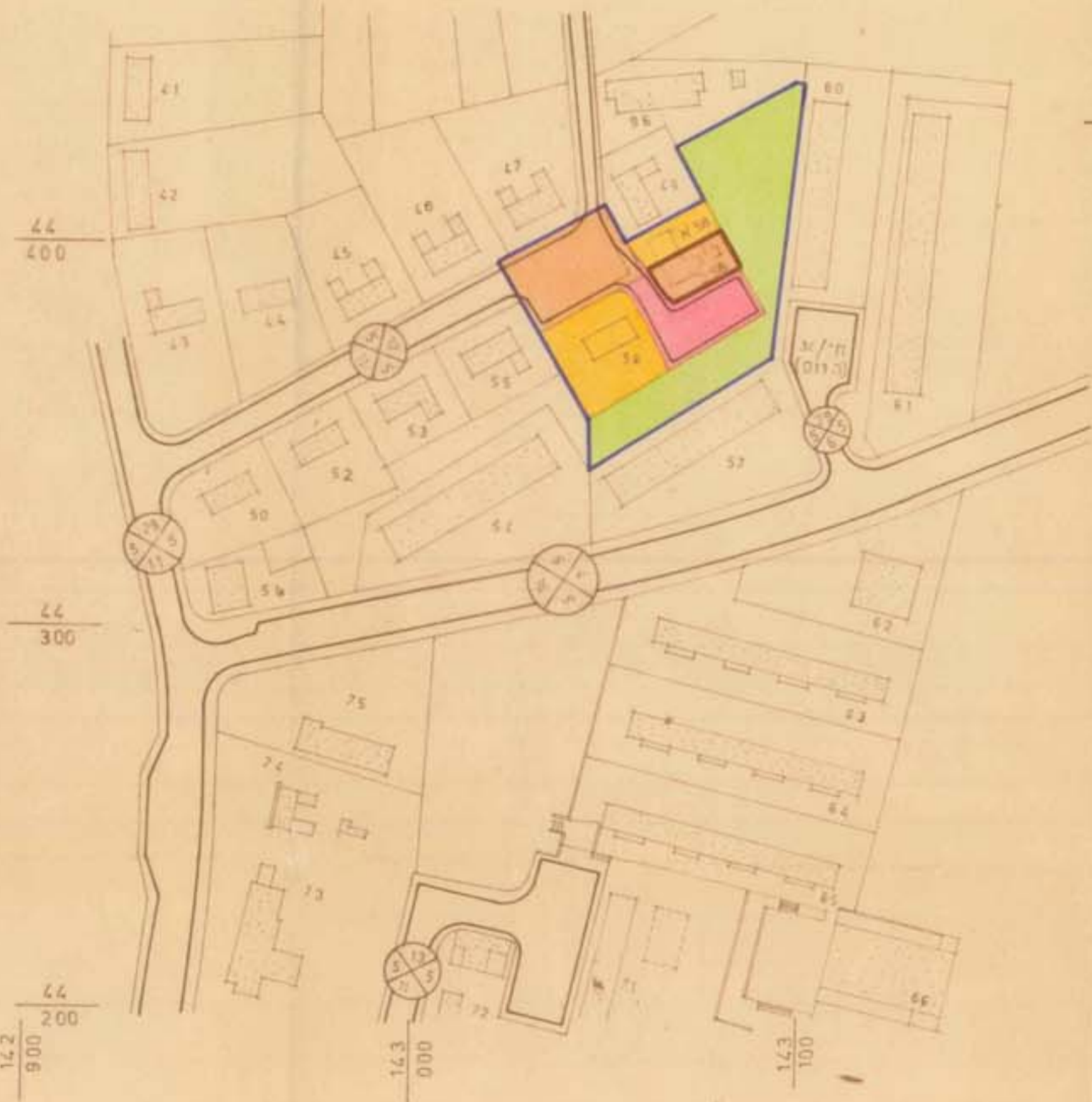
תכנית מוצעת ק.מ. 1:1250