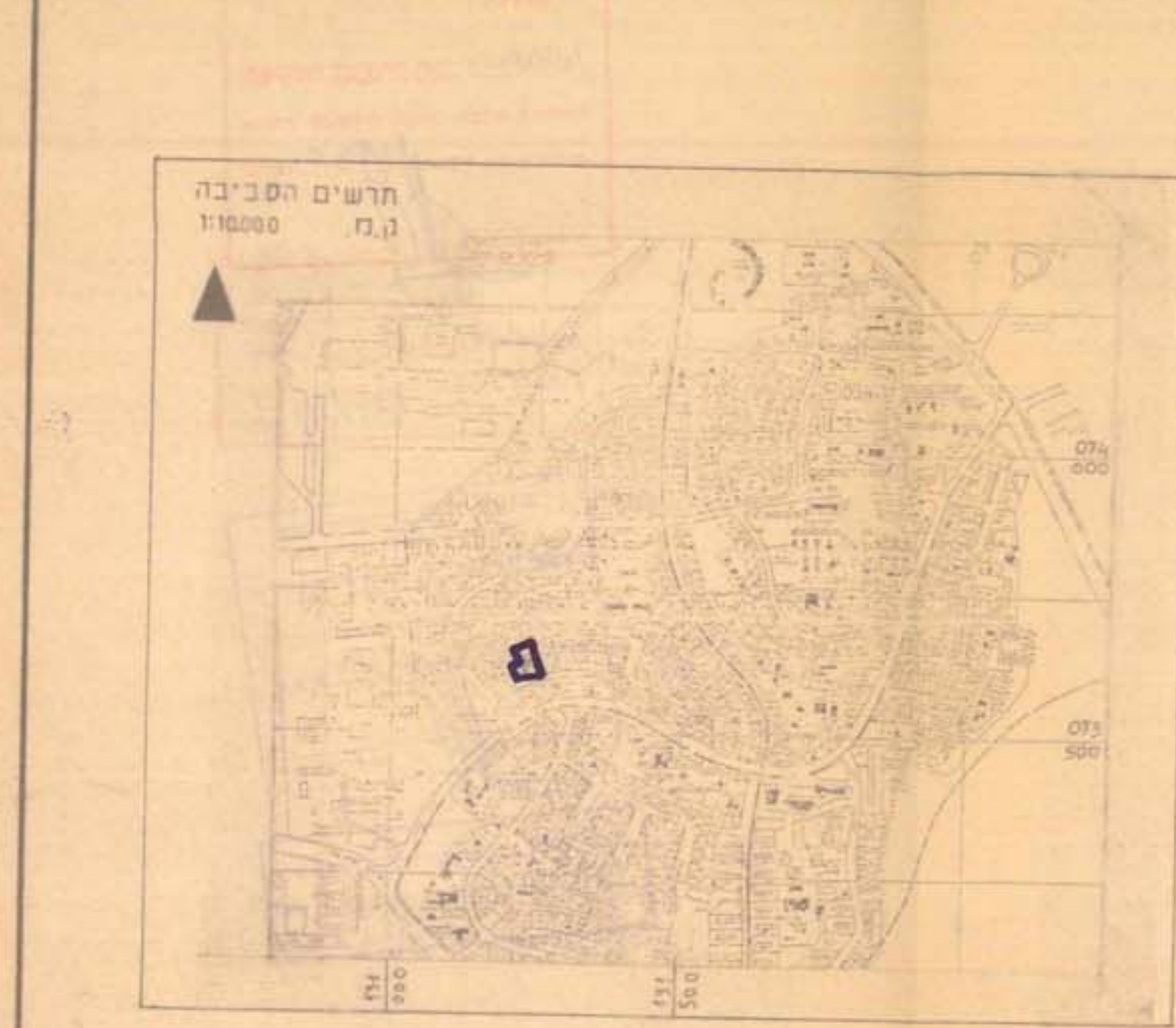
תרשים הסביבה ק.מ. 1:10000

מנהל מקרקעי ישראל משרד הבינוי והשיכון רח' הנסור - 6 סיכור תל אביב-יפו 6100000 טל. 30117 - 30117 מנהל רח' הנסור מנהל רח' הנסור