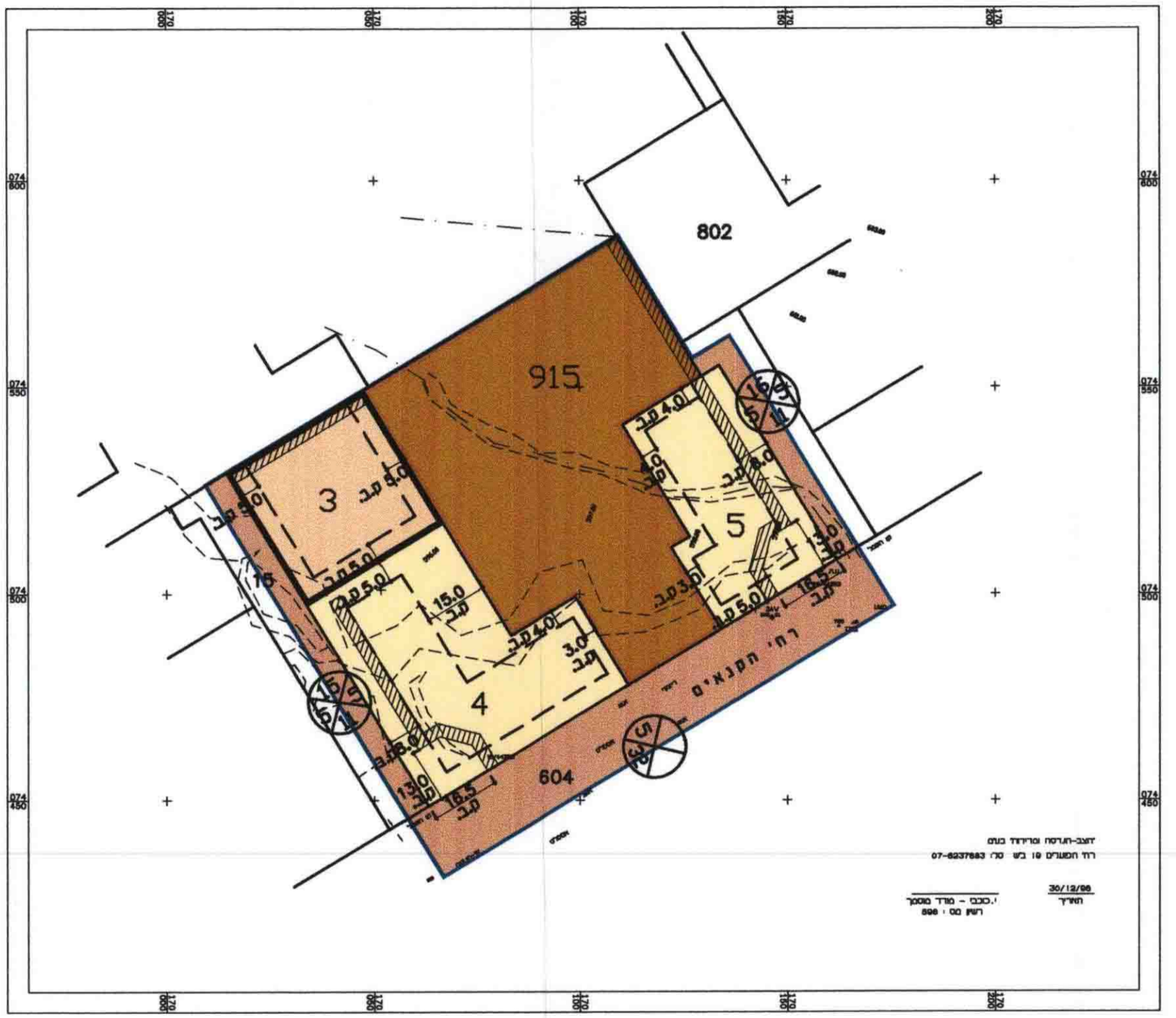
מצב קיים ומוצע קנ"מ 1:1250