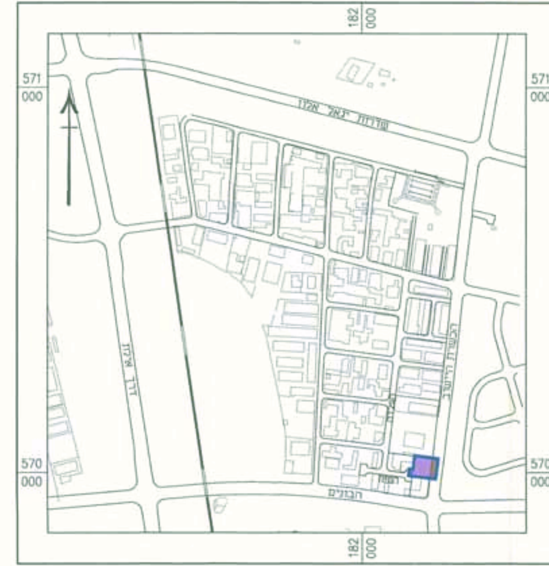
תרשים סביבה 1:10000