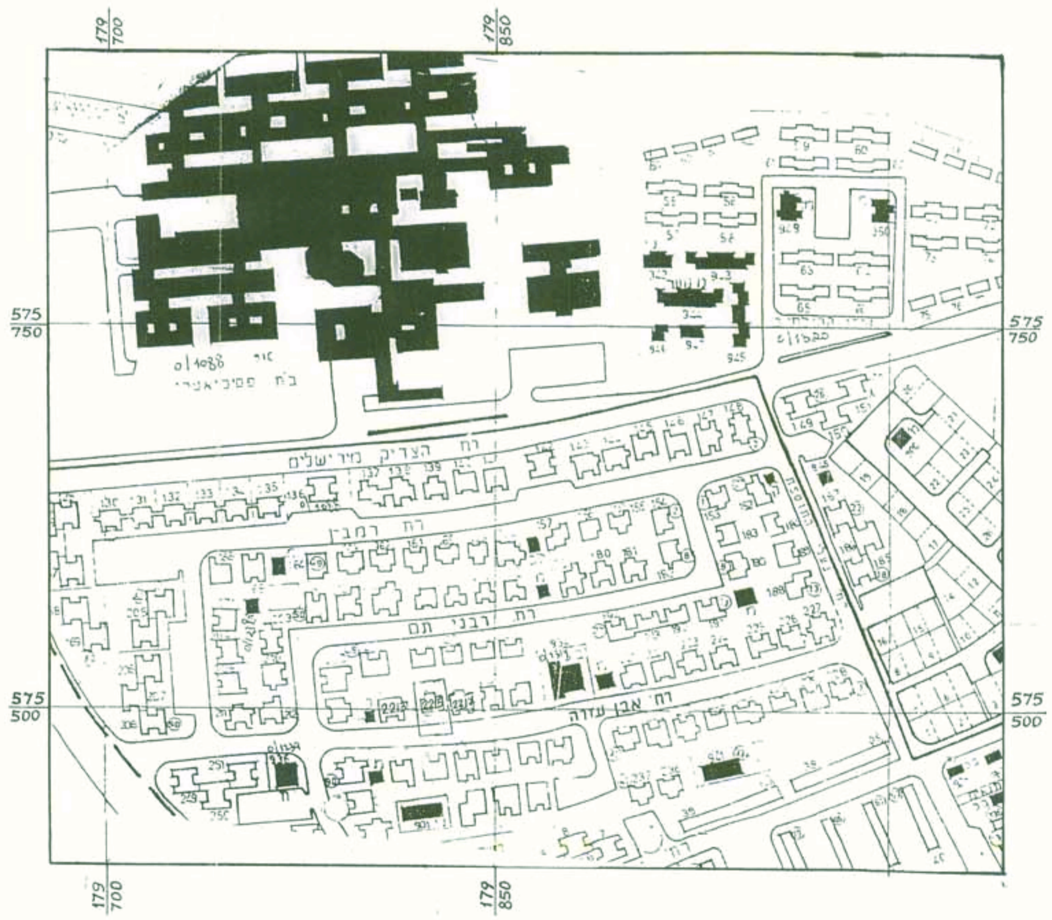
חדשים סביבה ק.מ. 1:2500

חתימת בעל הקרקע חתימת עורך התכנית חתימת יודם התכנית