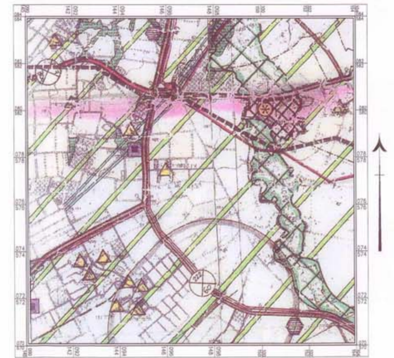
תרשים סביבה ק"מ 1:250,000