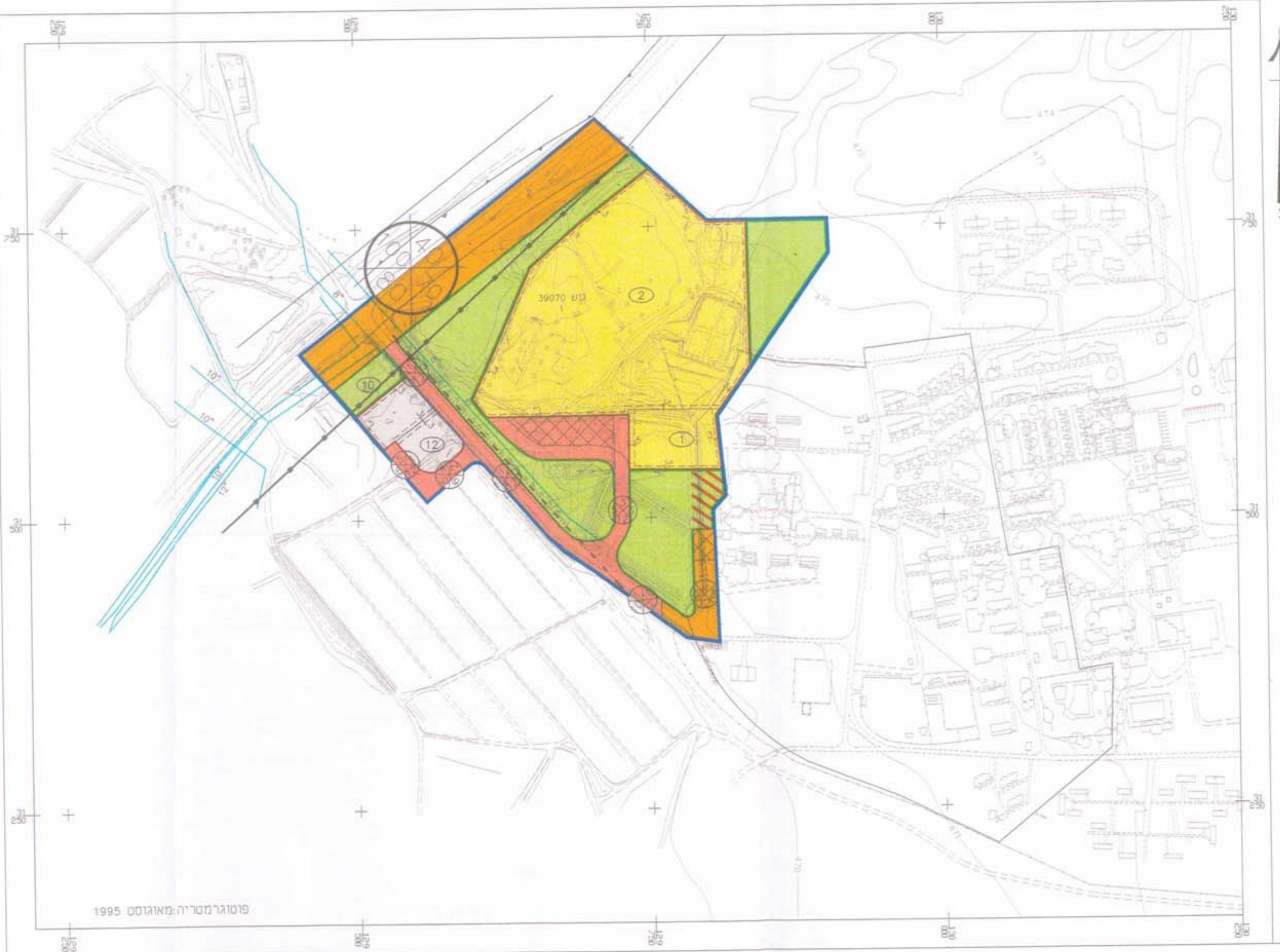
קנה מידה 1:2500