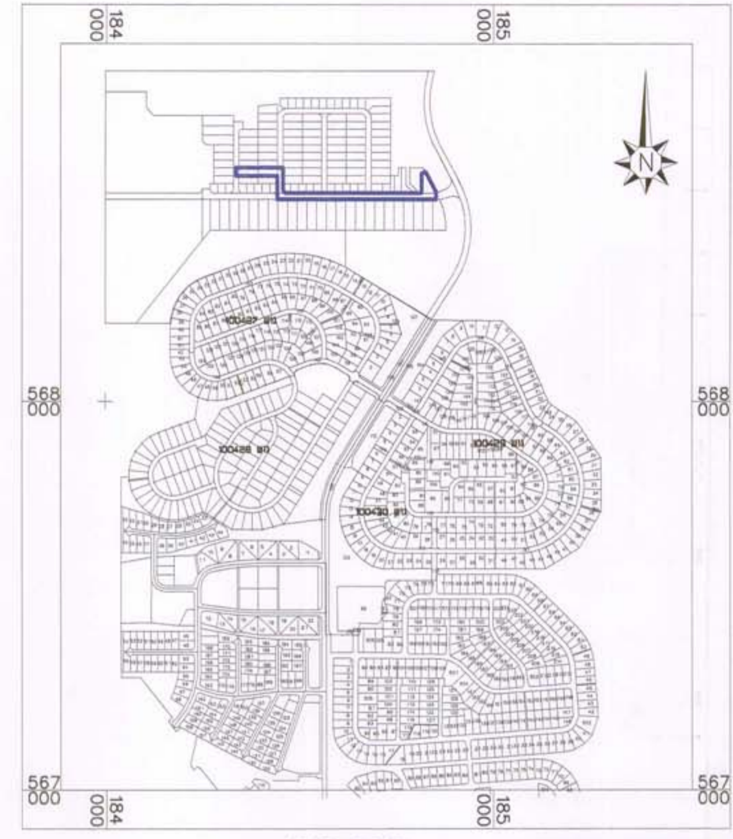
תרשים הסביבה ק.מ. 1:10000