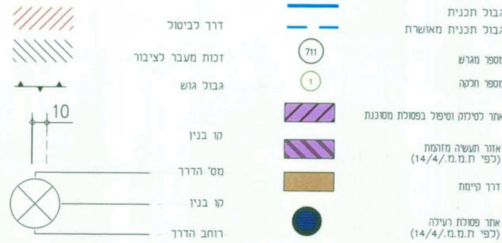
מצב קיים ק.ח. 1:1250