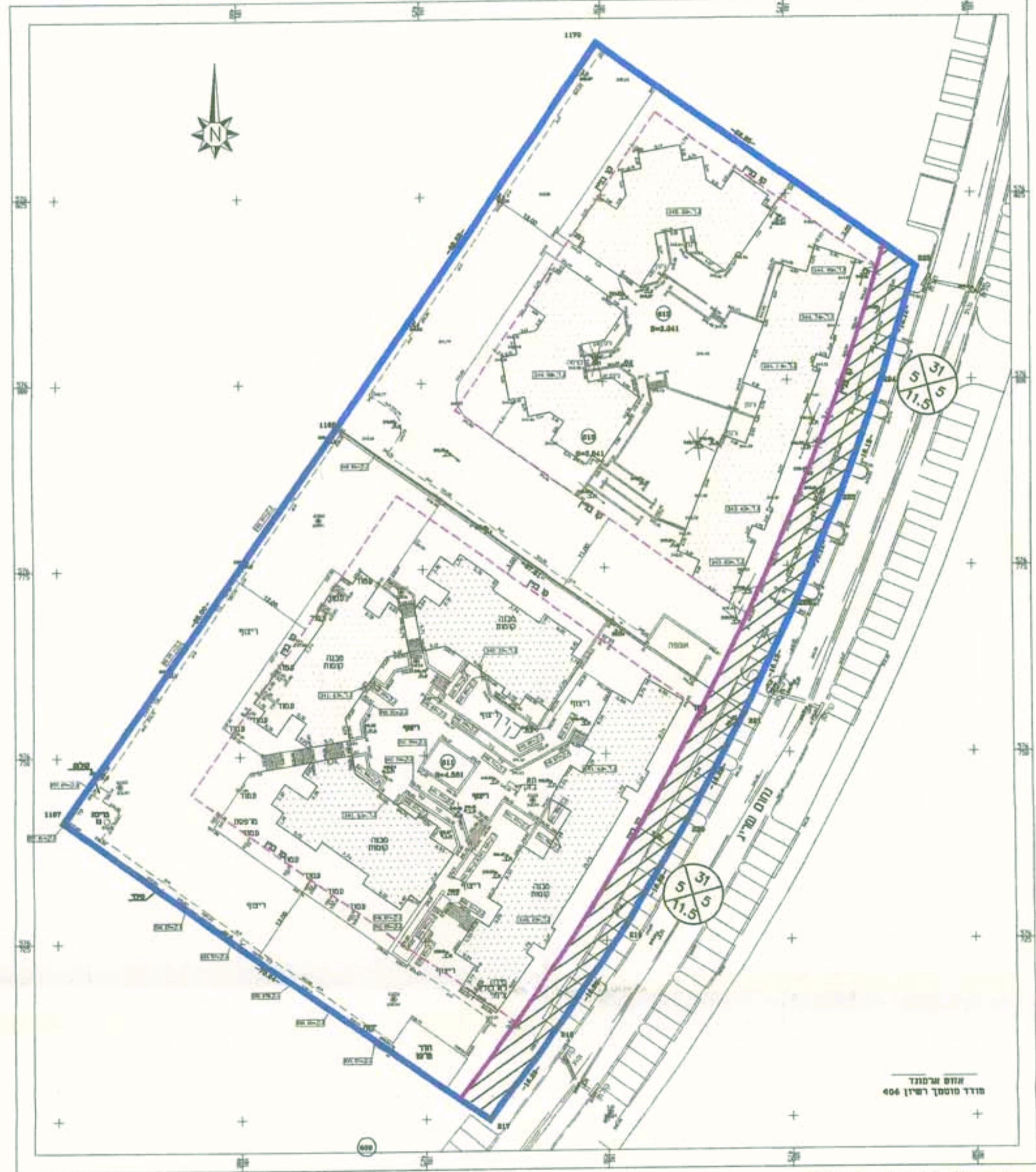
תכנית מצב קיים ק.מ. 1:500