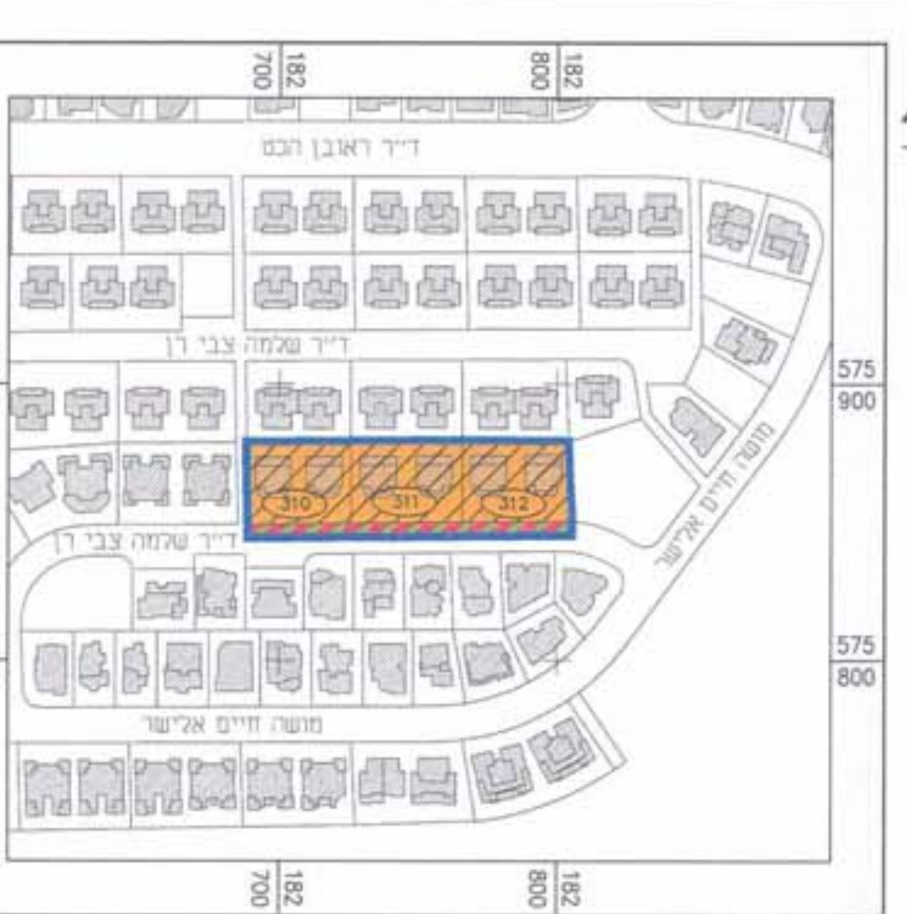
תרשים סביבה 1:2500