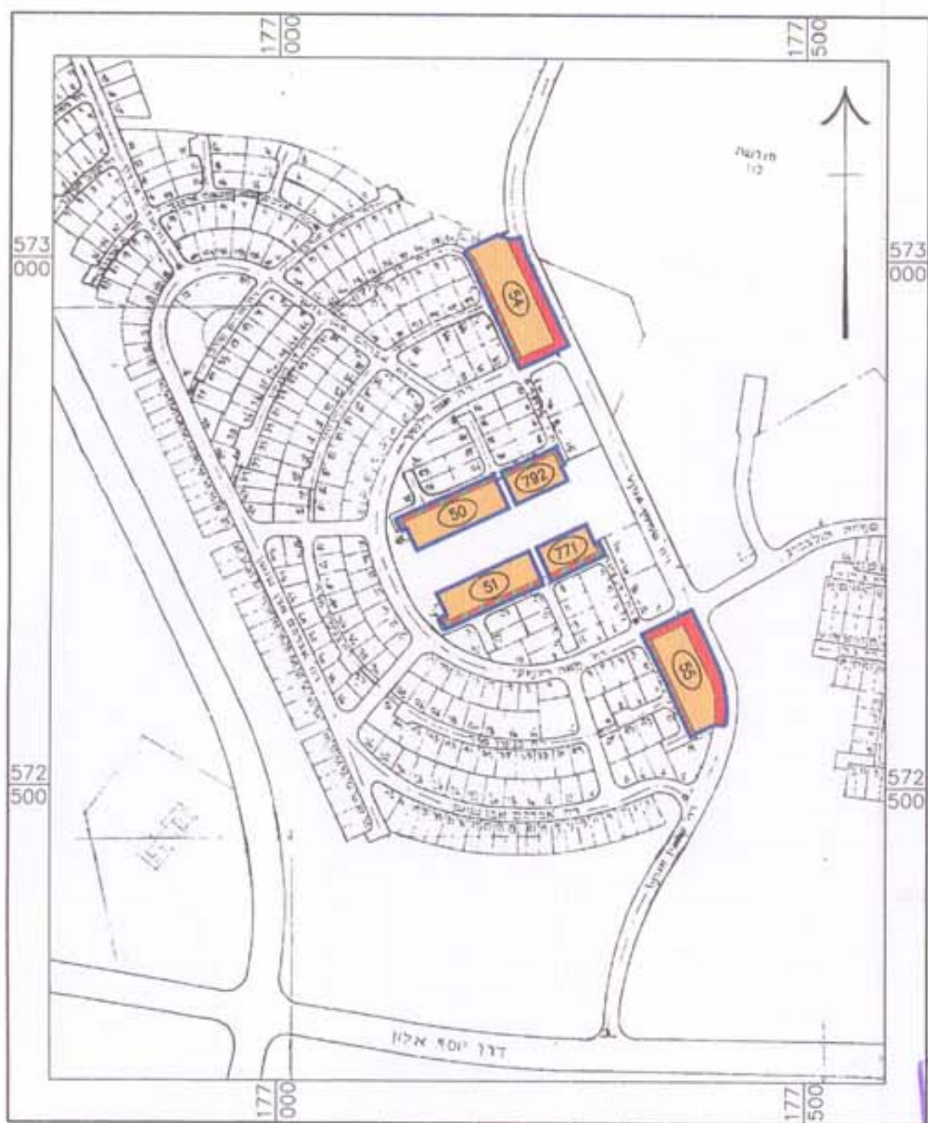
תרשים סביבה 1:5000

חתימות: ליפובצקי נטליה אדריכלות כ.ר.ר. 104717 עורך התכנית: אפרים פרימן מודד מסתן מ"ר 513 מנהל מ"ר-מ"ר מדינות ניהול תכנון