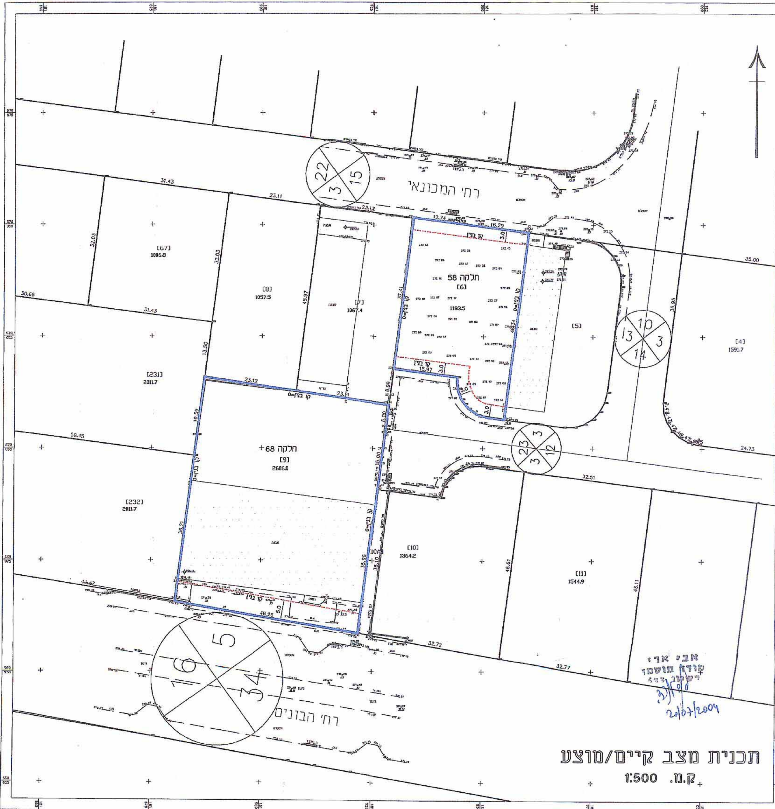
תכנית מצב קיים/מוצע 1:500 ק.מ.