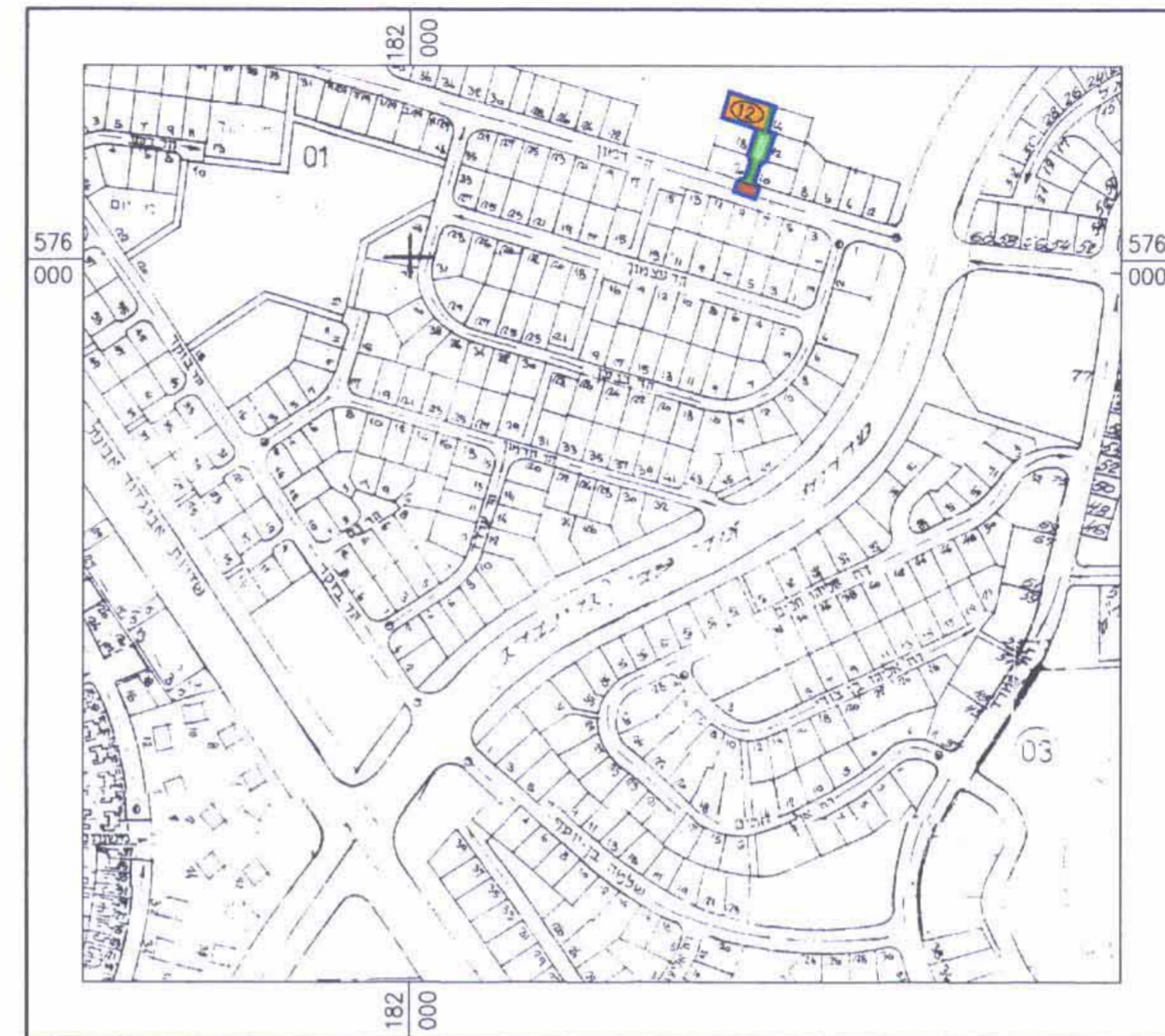
תרשים סביבה 1:5000