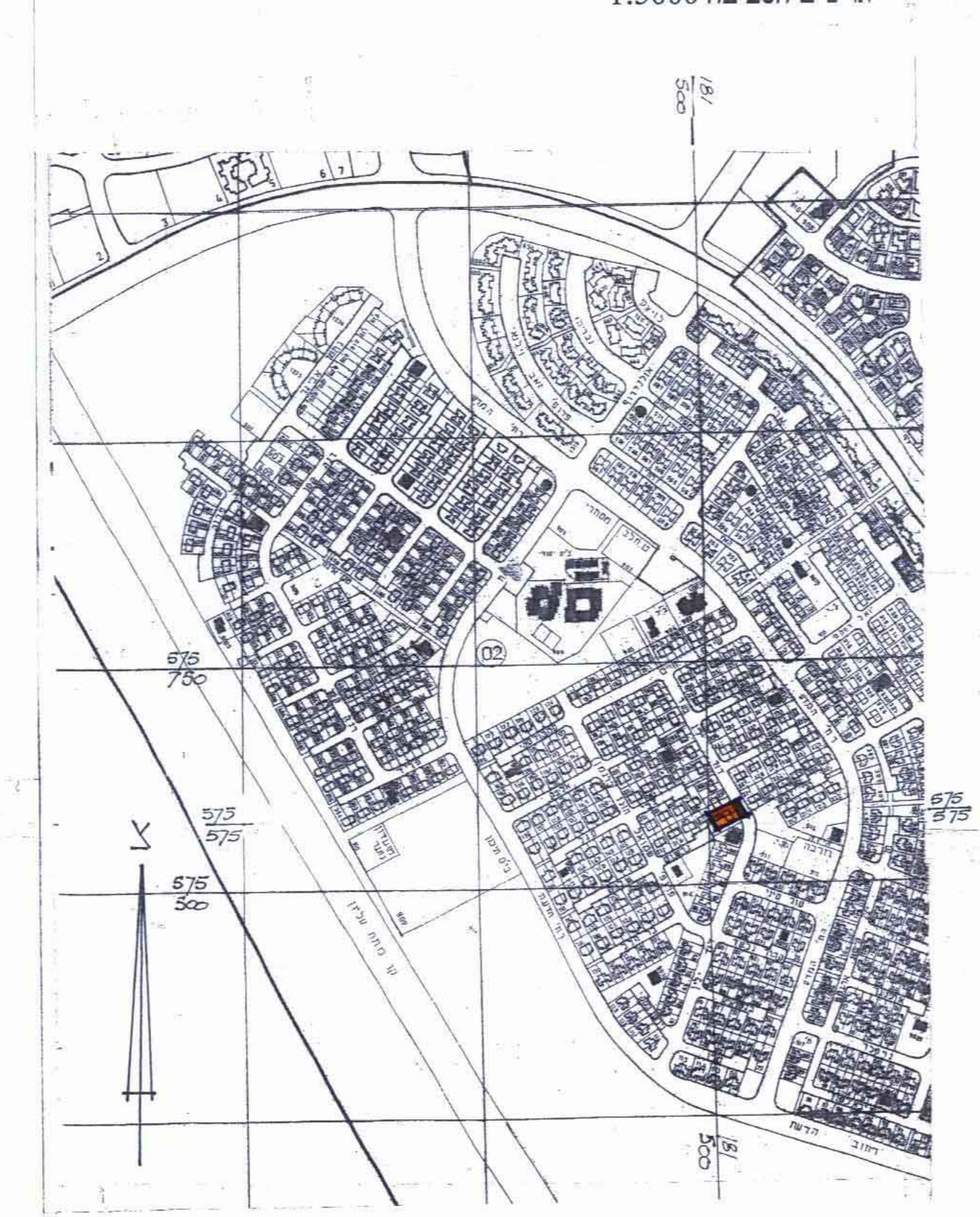
תרשים הסביבה 1:5000