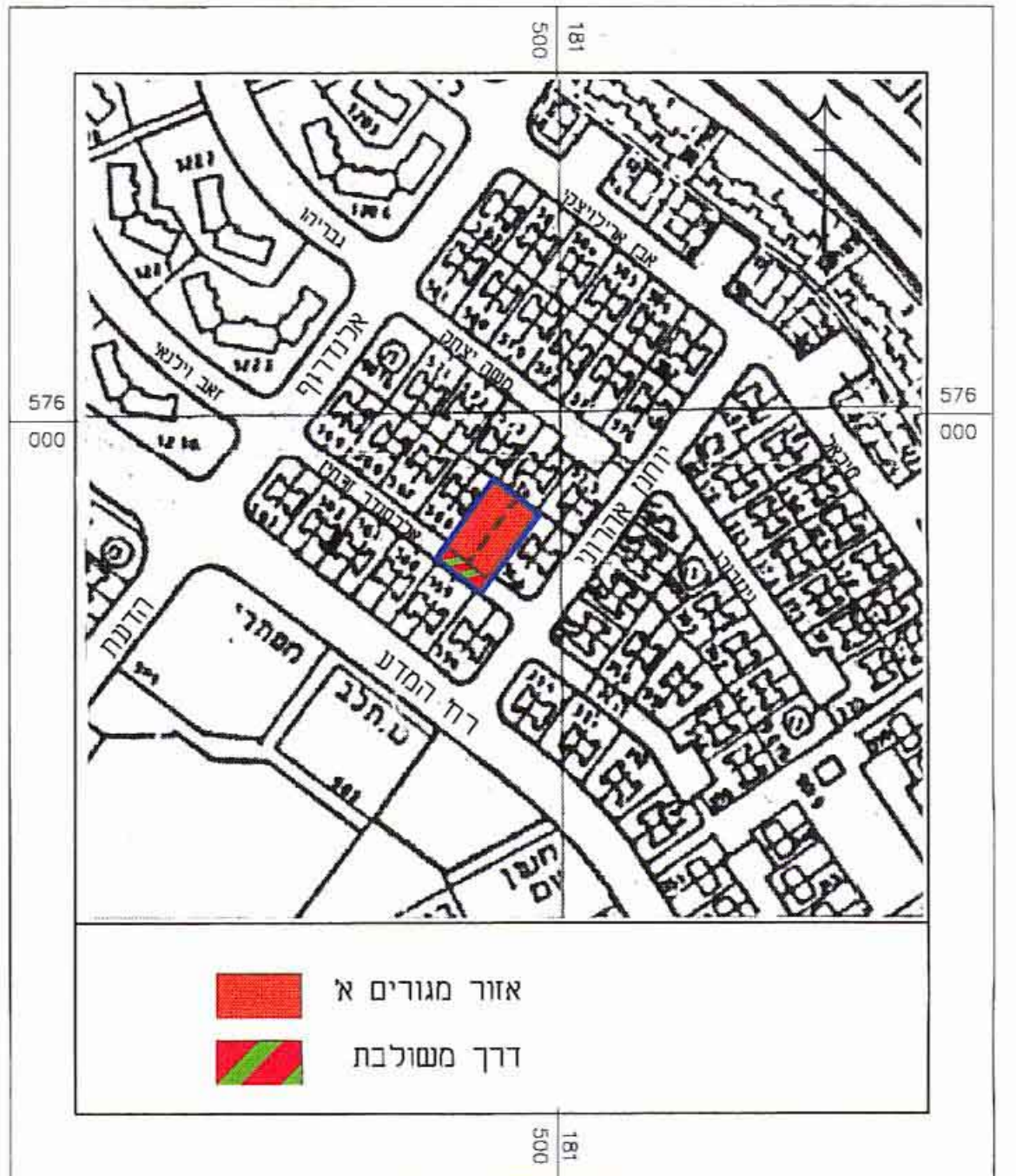
תרשים סביבה קני"מ 1:2500