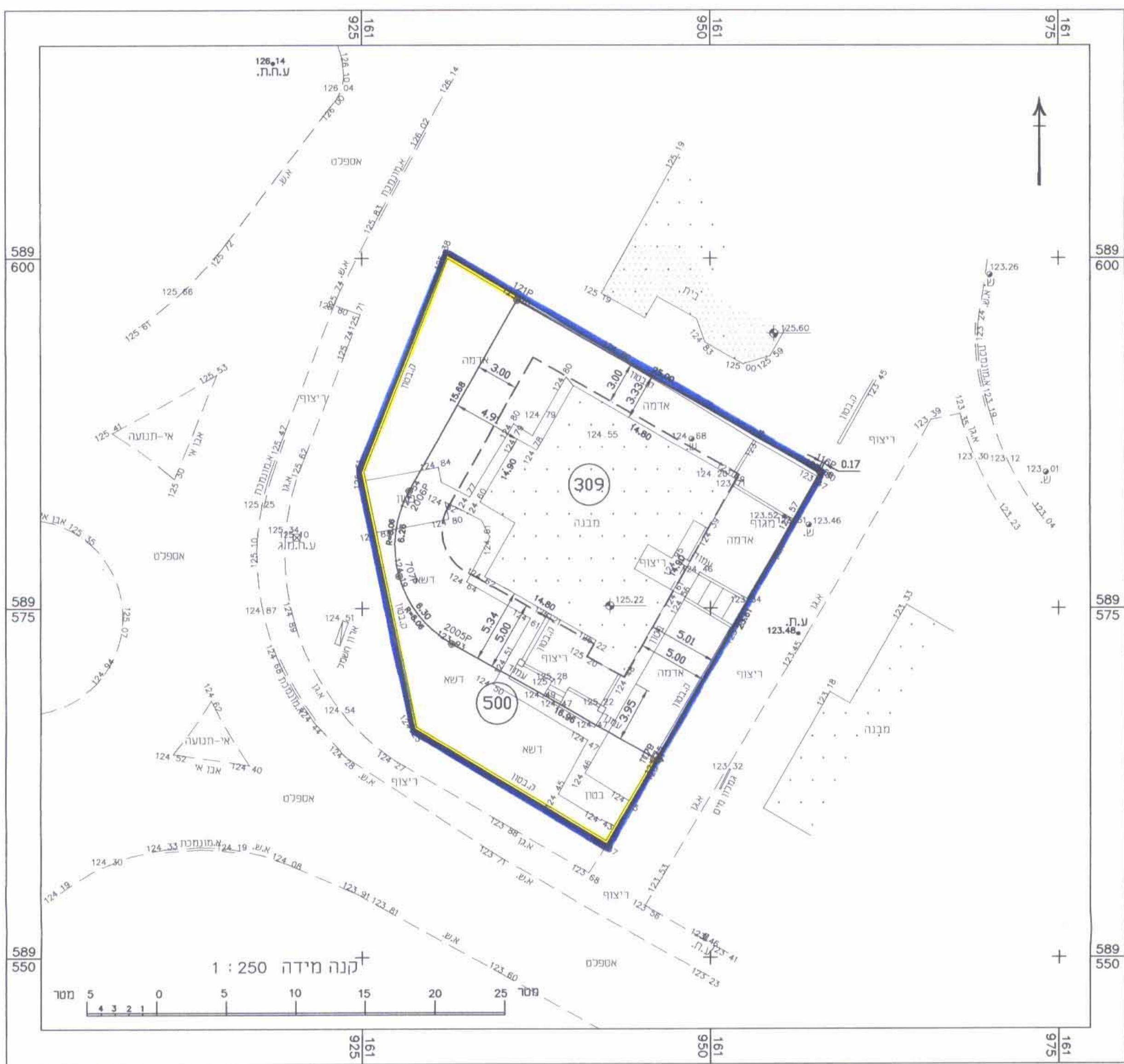
מצב מוצע ק.מ. 1:250