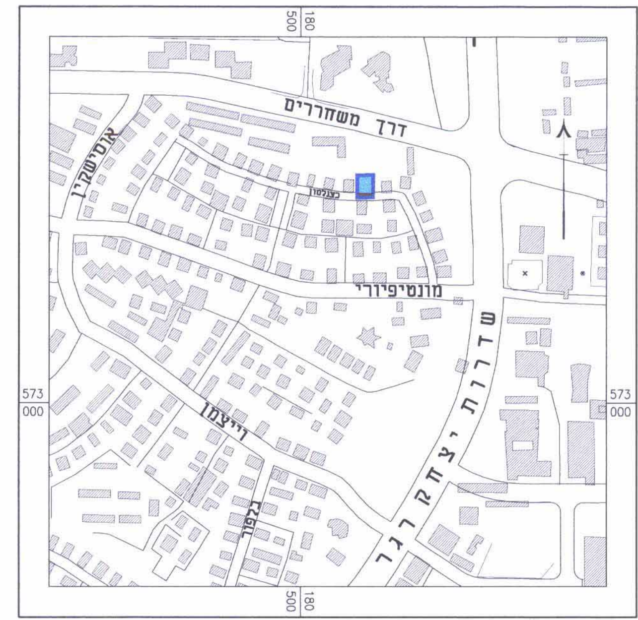
תרשים סביבה 1:5000

הודעה על בעלי הקרקע מרצה פיקוח המסוננים נס. 556