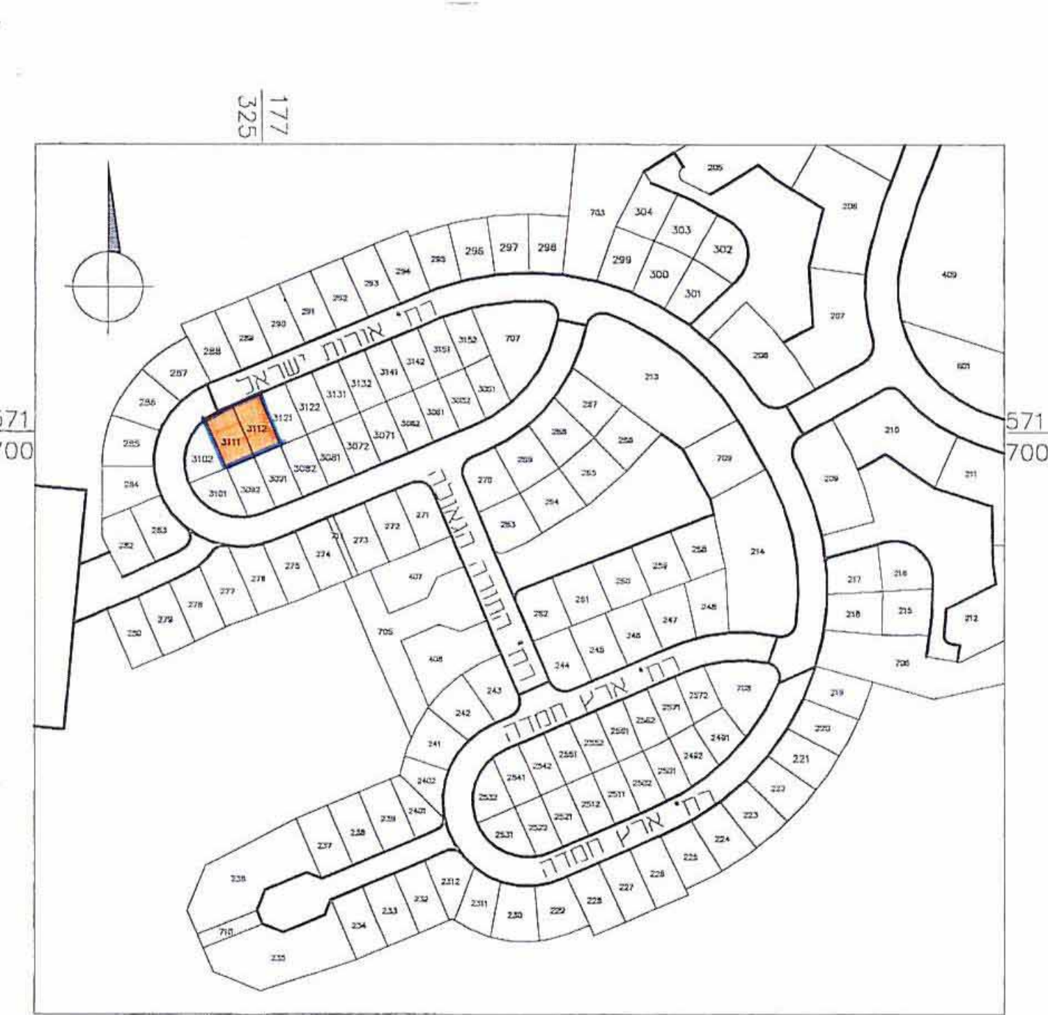
חרישים הסביבה 1:2500