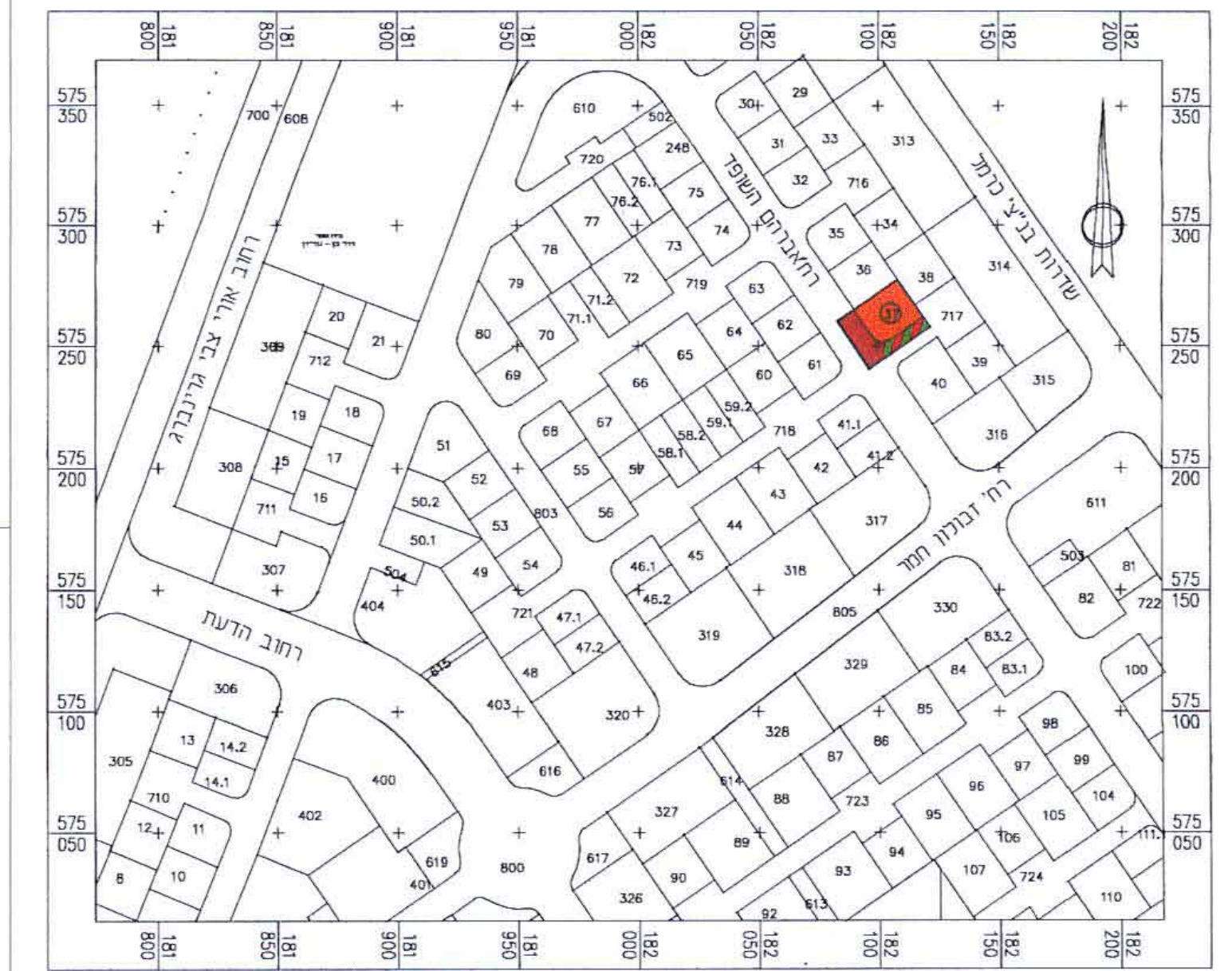
תרשים סביבה ק"מ 1:2500