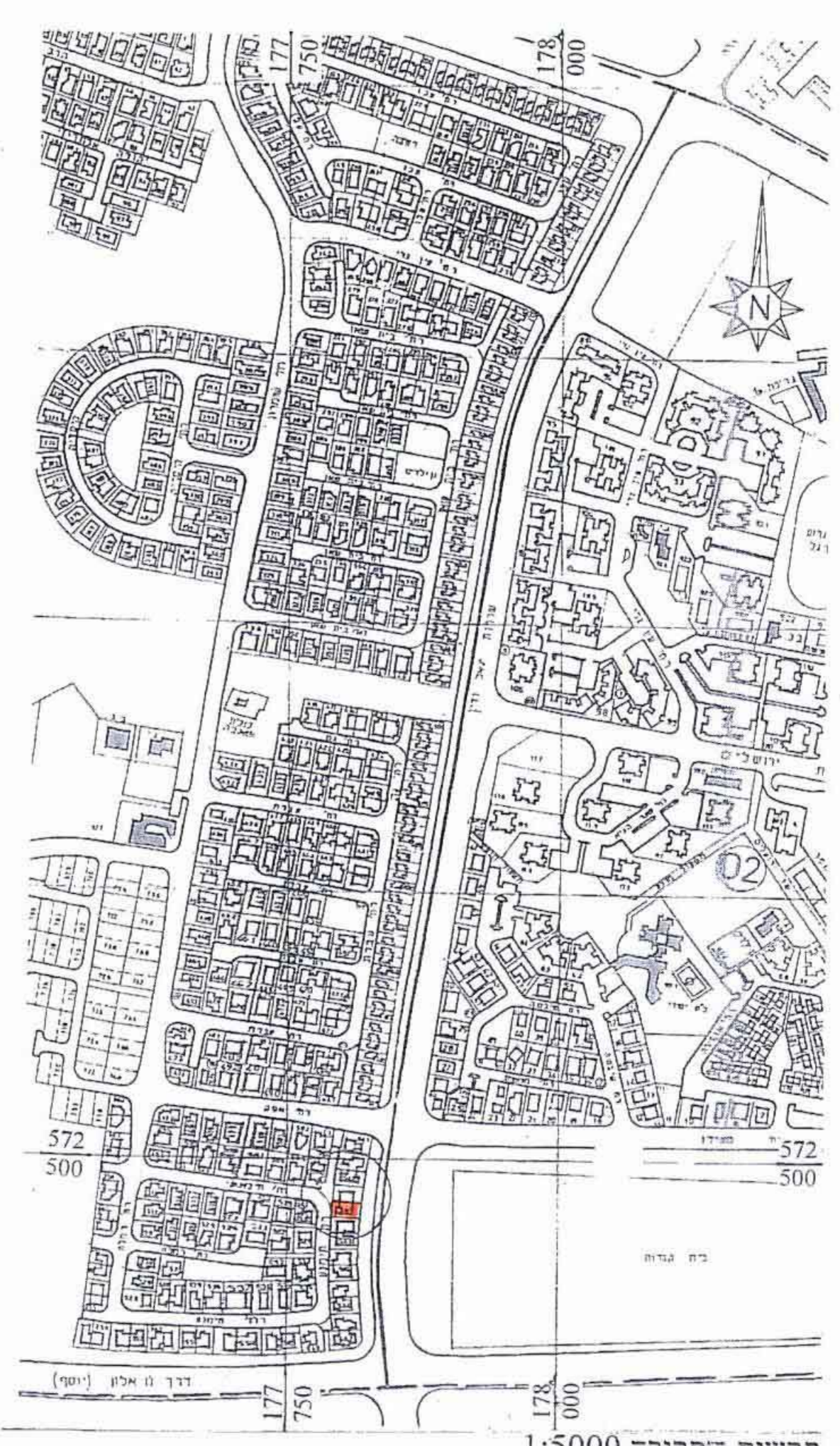
תרשים הסביבה 1:5000