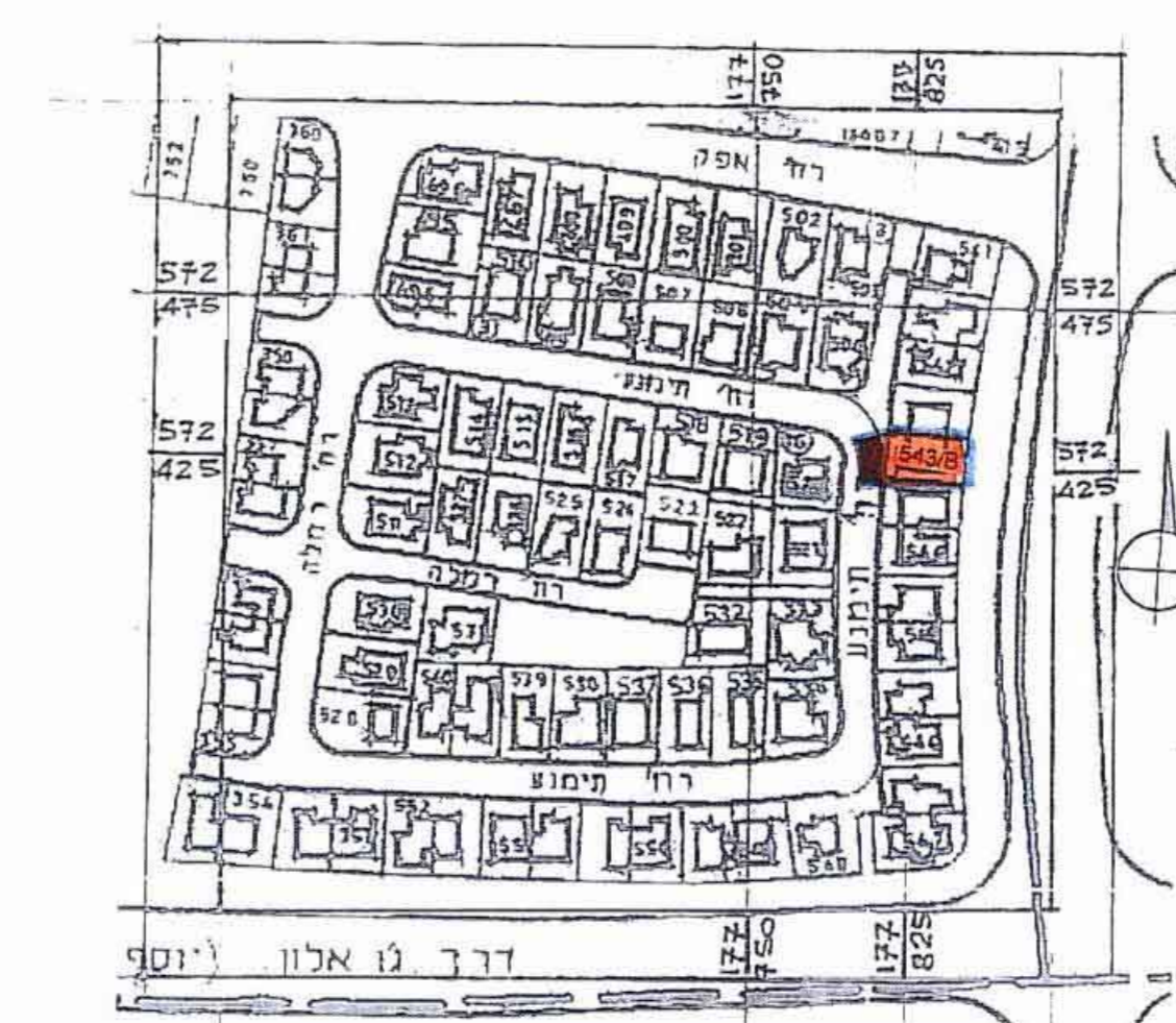
תרשים הסביבה 1:2500